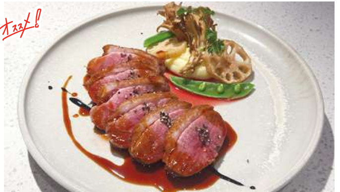
Roasted Duck Breast with Bigarade Sauce(Bitter Orange Sauce)