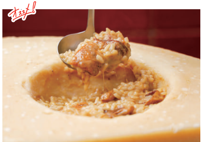
Cheese risotto with porcini mushrooms ポルチーニ茸のチーズリゾット