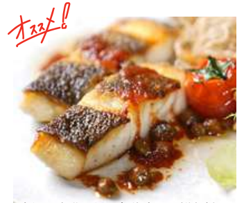
高知県漁港からの直送 本日の鮮魚料理