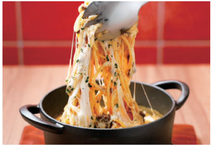
Cheese meat sauce gratin with spaghetti ~VULCANO~ チーズボロネーズ ~ヴォルカーノ~