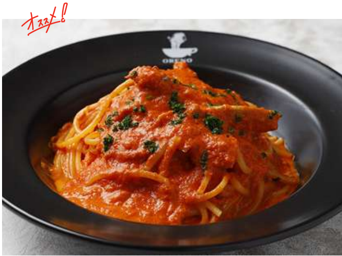
Spaghetti with Tomato Cream Sauce & Blue Crab ワタリガニのトマトクリームソース スパゲッティ