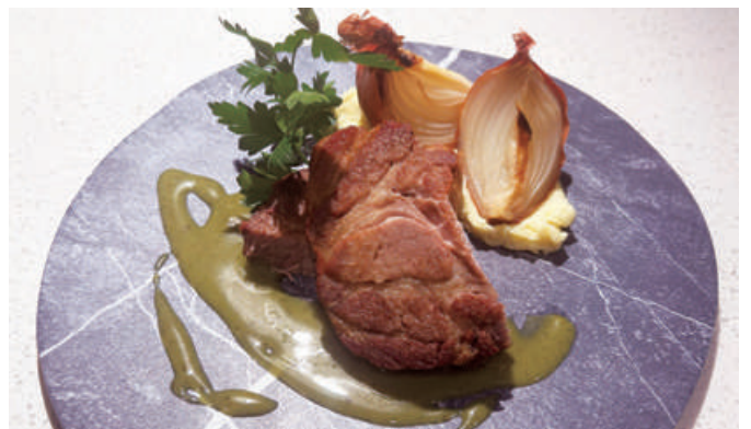
Canadian Pork Shoulder Confit with Green Mustard Sauce

高知県からの直送の新鮮なお魚料理。 内容はスタッフにお尋ねください。 1,800 (税込1,980)