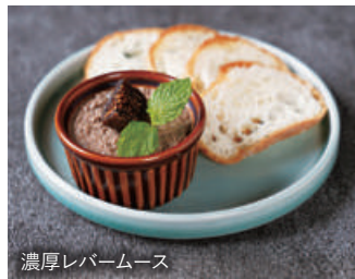
濃厚レバームース