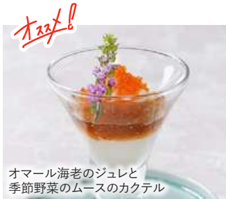
オマール海老のジュレと 季節野菜のムースのカクテル