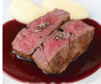
牛フィレ肉のステーキ 赤ワインソース

イタリアの偉大なオペラ作曲家であり、美食家の「ジョアキーノ・ロッシェニ」が考案した逸品で、ミディアムレアに焼かれた厚切りの牛フィレ肉に、フォアグラのソテーと、トリュフをたっぷり使った「ベリゲーソース」をまとわせた「ロッシェニ」は、俺のシリーズの原点ともいえるメインディッシュです。ソースが本当に美味しいので、ぜひパンをつけて残ったソースまでお楽しみくださいませ!