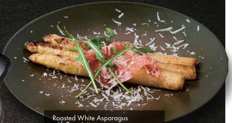
Roasted White Asparagus with Prosciutto