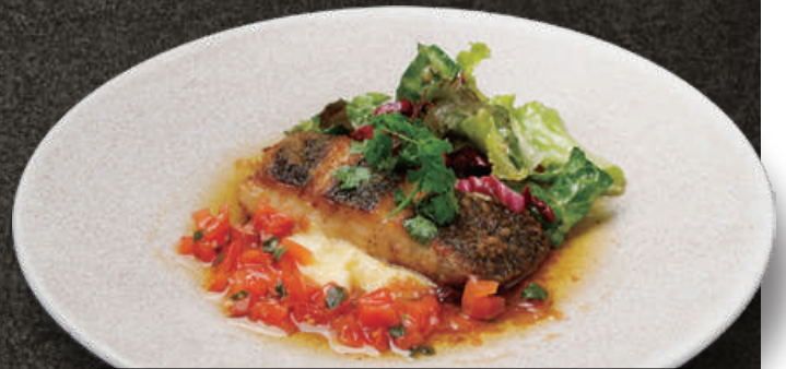
Fish Dish of the Day 本日のお魚料理 1,680(税込 1,848)

※写真はイメージです。内容はスタッフまでお尋ねください。 Image for illustrative purposes only. Please ask the staff about the Dish.