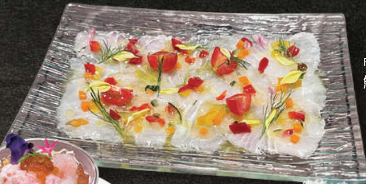
Fresh Fish Carpaccio 鮮魚のカルパッチョ 1,280 (税込1,408)