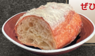
アヒージョやビーフシチューと ぜひ一緒に!