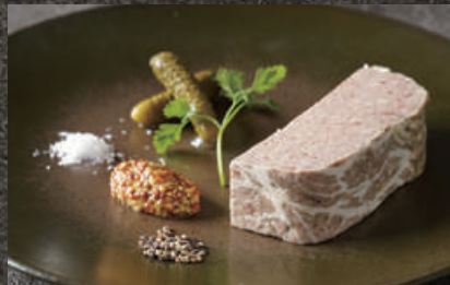
Meat Terrine with Foie Gras フォアグラ入り お肉のテリーヌ 680 (税込748)