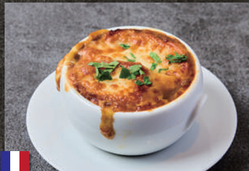
French Onion Soup オニオングラタンスープ 580 (税込 638)