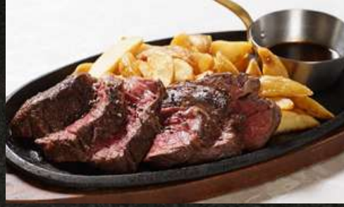
Roasted beef skirt steak (250g) 牛ハラミ肉のロースト 2,480 ～赤ワインソース～ (250g) (税込 2,728)