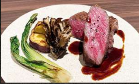
A4 Wagyu Loin Steak A4和牛ロースのステーキ 4,980 (税込 5,478)