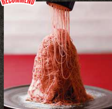
Strawberry Mont Blanc (Finished Tableside) 俺の名物! 生搾りイチゴのモンブラン 1,280(税込1,408)