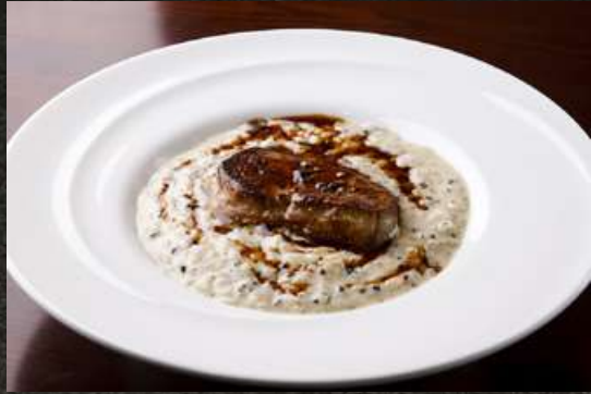
Foie Gras and Truffle Risotto フォアグラと黒トリュフのリゾット 1,980(税込2,178)