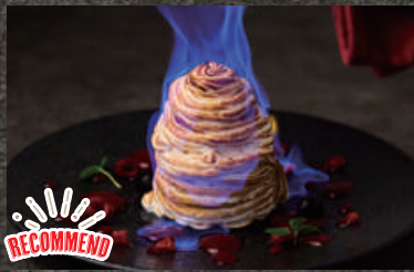
Baked Alaska (Ice Cream Cake with Baked Meringue) バイクドアラスカ 980 (焼きメレンゲのアイスケーキ) (税込1,078)