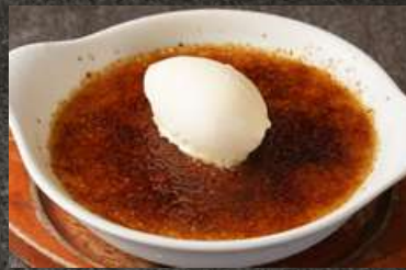
Crème Brûlée with Ice Cream クレームブリュレ 680 アイス添え (税込748)