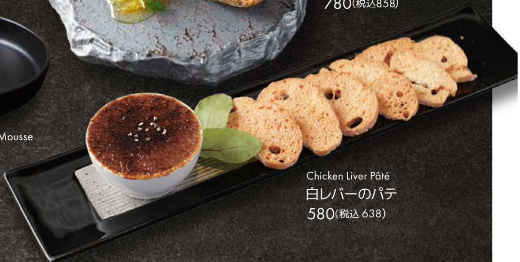
Chicken Liver Pâté 白レバーのパテ 580(税込 638)