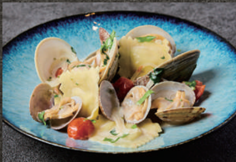
White Clams and Manila Clams Marinière with Cheese Ravioli 白ハマグリとアサリのマリニエール 1,380 ~チーズのラビオリ添え~ (税込 1,518)