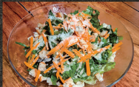
Oreno French Salad 俺のフレンチサラダ 980 (税込1,078)