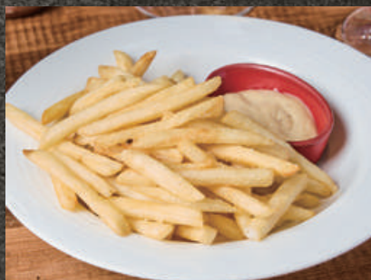
French Fries with Anchovy Mayonnaise フレンチフライ 580 ~ アンチョビマヨネーズ添え ~ (税込 638)