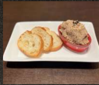
Pork Rillettes 豚肉のリエット 480 (税込 528)