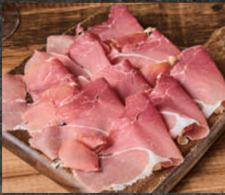
Aged Prosciutto 熟成生ハム 980 (税込 1,078)