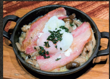
Mushroom and Iberico Bacon Estofado ~ Topped with a Soft-Boiled Egg ~ キノコとイベリコベーコンの エストファード温玉のせ 980 (税込 1,078)