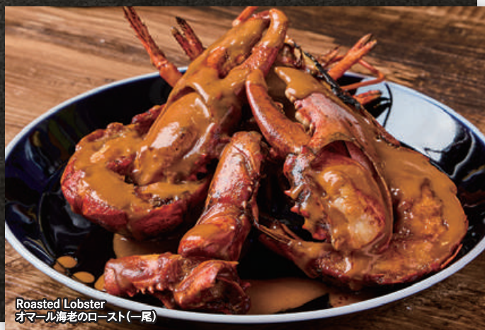
Roasted Lobster オマール海老のロースト(一尾)

Fish Dish of the Day 本日の鮮魚料理 1,780(税込1,958) ※内容はスタッフまでお尋ねください Please ask the staff about the Dish.