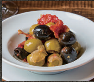
Marinated Sun-Dried Tomatoes & Olives ドライトマトと オリーブのマリネ 480 (税込 528)