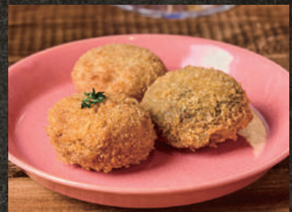
Trio of Risotto Croquettes 3種のリゾットコロッケ 480 (税込 528)