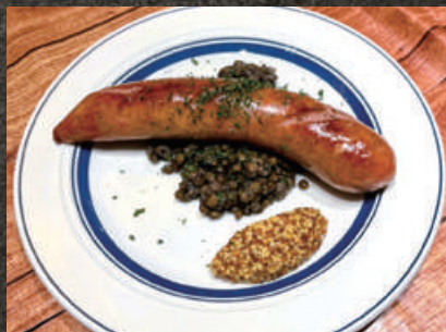
Grilled Jumbo Sausage 特大ソーセージのグリエ 1,080 (税込 1,188)