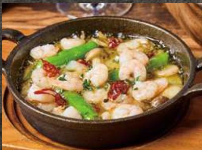
Shrimp, Yuba, and Mushroom Ajillo 海老・湯葉・キノコの アヒージョ 980 (税込 1,078)