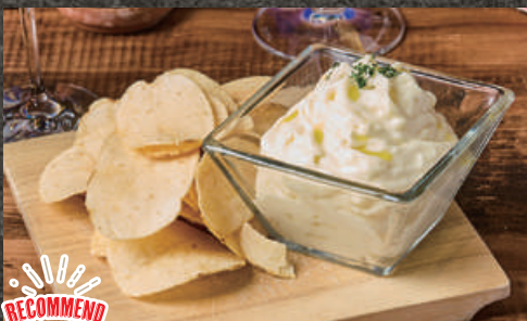
RECOMMEND Truffle-Scented Potato Espuma トリュフ香る なめらかポテトサラダ ~ジャガイモのエスプーマ~ 【Regular】 780 (税込 858) ハーフサイズ 【Half size】 480 (税込 528)