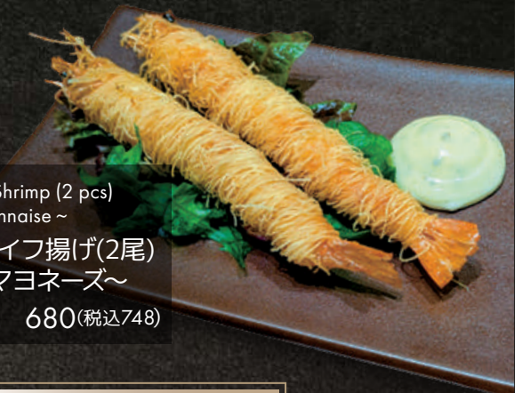
Crispy Kataifi Shrimp (2 pcs) ~ Truffle Mayonnaise ~ 海老のカダイフ揚げ(2尾) ~ トリュフマヨネーズ ~ 680(税込748)