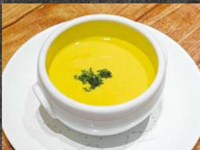
Seasonal Potage 季節のポタージュ 480 (税込 528)