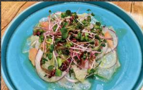
Sea Bream Carpaccio 真鯛のカルパッチョ 980 (税込1,078)