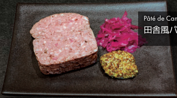
Pâté de Campagne 田舎風パテ 980 (税込1,078)