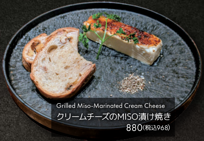
Grilled Miso-Marinated Cream Cheese クリームチーズのMISO漬け焼き 880(税込968)