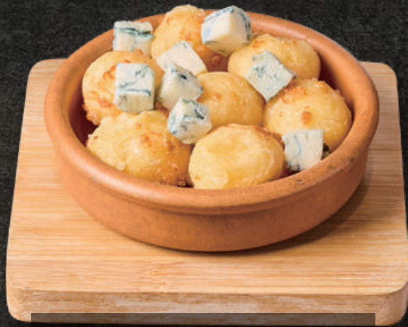
Focaccia with Blue Cheese もっちりフォカッチャとブルーチーズ 680(税込748)