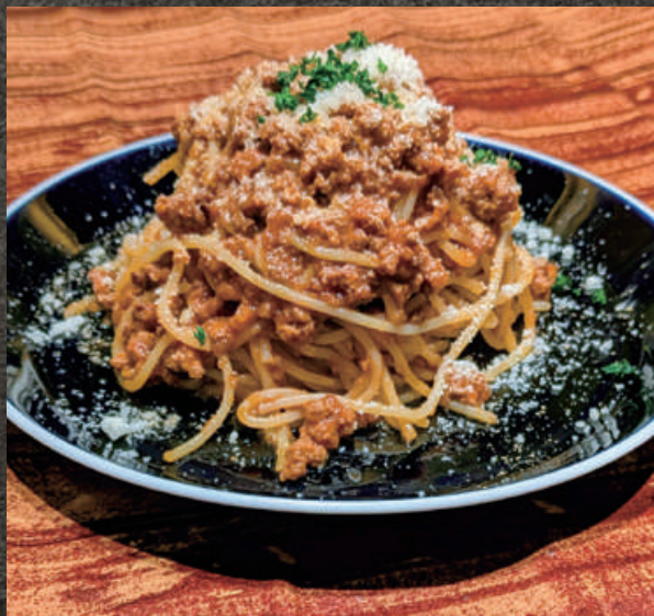
Bolognese Pasta ボロネーゼパスタ 1,280(税込1,408)