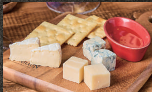
Assortment of 3 Cheeses チーズ3種盛り合わせ 1,280 (税込 1,408)