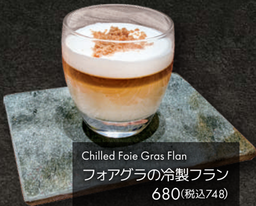
Chilled Foie Gras Flan フォアグラの冷製フラン 680(税込748)