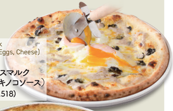
Special Bismarck (Truffe, Porcini, Eggs, Cheese) 俺の名物 トリュフ薫るビスマルク (チーズ・卵・キノコソース) 1,380(税込1,518)