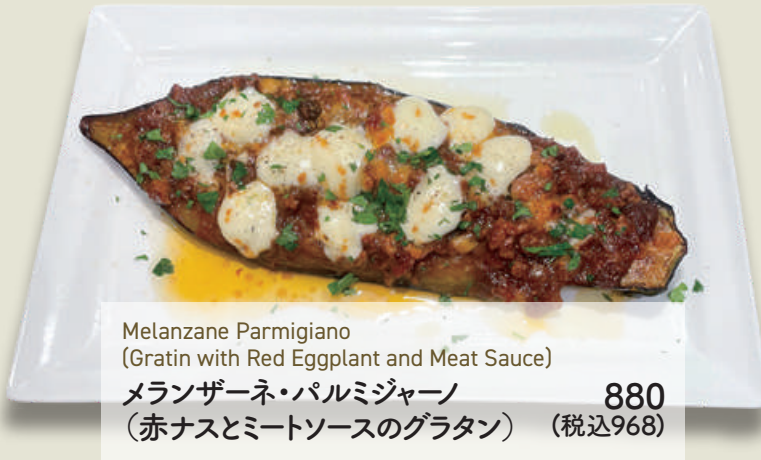
Melanzane Parmigiano (Gratin with Red Eggplant and Meat Sauce) メランザーネ・パルミジャーノ 880 (赤ナスとミートソースのグラタン) (税込968)