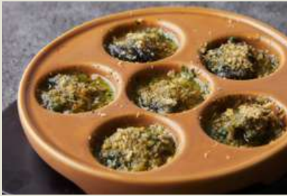
Oven-Baked Escargot with Herb Butter おすすめ エスカルゴの香草バターの 780 オーブン焼き (税込858)