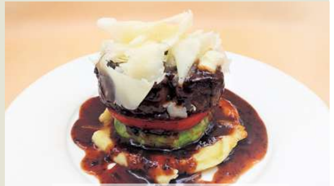
Beef Tenderloin & Tomato & Avocado and Raspadura Cheese with Truffle Sauce Italian Color Style