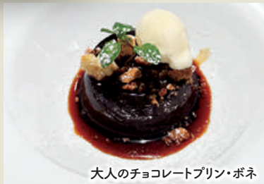
大人のチョコレートプリン・ボネ