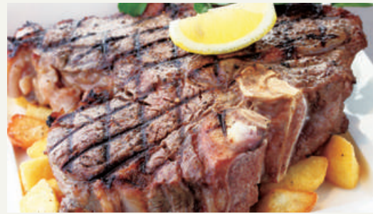
Limited Quantity T-bone Steak (1kg) ※3名様以上でご注文可能です。