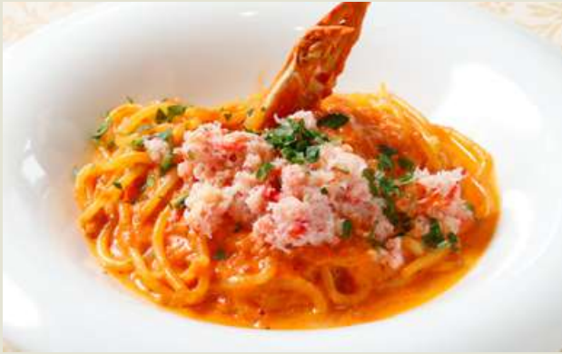
Tomato Cream Pasta with Plenty of Crab カニたっぷりトマトクリームパスタ

当店のパスタは、イタリア マンチーニ社のスパゲティ 及び淡路麺業の生パスタを 使用しています。