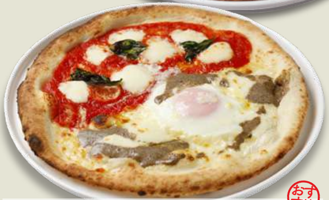
Half-and-Half (Choose Your 2 Favorite P`izza) おすすめ 上記のピザから好きな2種類をお選びください 1,580 選べるハーフ&ハーフ (税込1,738)