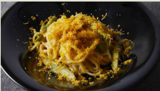
Ario Rio Spaghetti with Karasumi and Kujo Green Onions カラスミと九条ネギの アーリオオーリオスパゲッティ