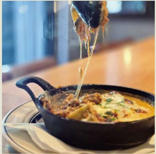
Wagyu Beef Lasagna - Bologna Style - 黒毛和牛のラザニア ～ボローニャ風～