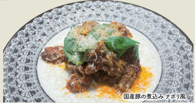
国産豚の煮込み ナポリ風

迷ったらコレ!! 新名物! 2,980 牛フィレ肉のトリコロレ (税込3,278)