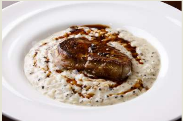
Porcini Mushroom Risotto with Topped with Foie Gras