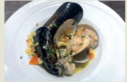
Fregola Alla Arselle (Steamed Mussels, Oysters, and Clams in White Wine) フレーゴラ・アッラ・アルセッレ (ムール貝・牡蠣・アサリの 白ワイン蒸し) 980 (税込1,078)