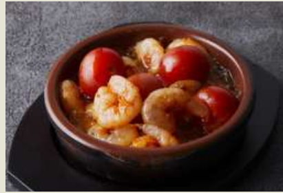
Ajillo with Shrimp and Cherry Tomatoes 海老とミニトマトのアヒージョ 880 (税込968)