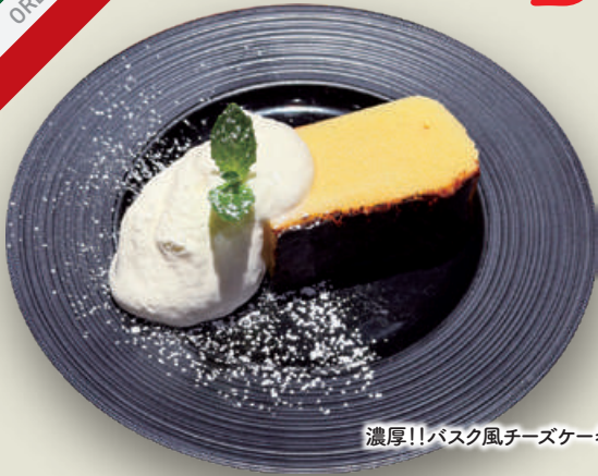
濃厚!!バスク風チーズケーキ