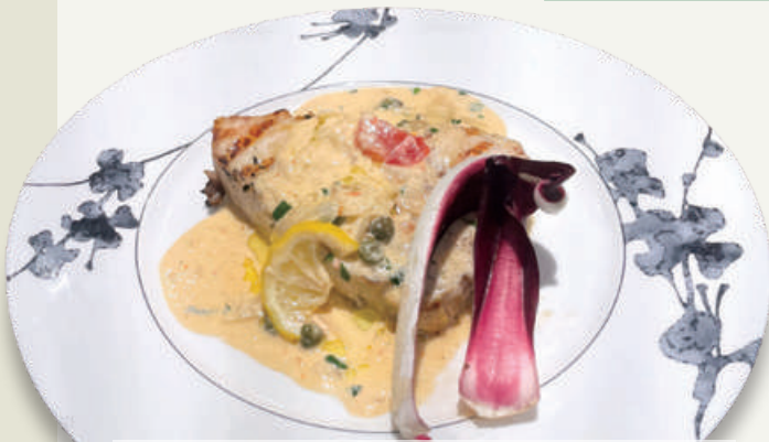
Grilled Swordfish with a Light Sicilian Lemon Cream Sauce