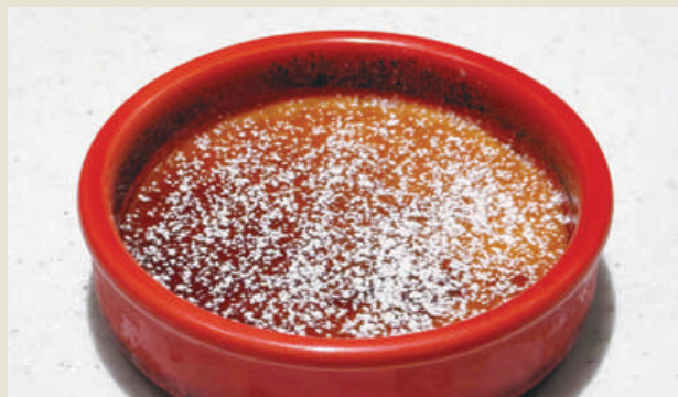
Catalana (Spanish-style Crème Brûlée) なめらかカタラーナ