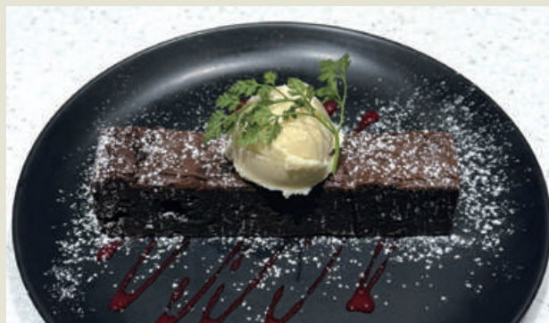
Gâteau Chocolate with Truffle Vanilla Ice Cream ガトーショコラとトリュフバニラアイス