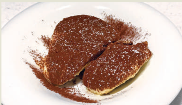
Homemade Tiramisu 自家製ティラミス