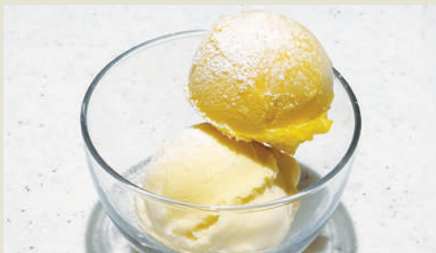
Today's Gelato (2 Flavors Assorted) 本日のジェラート2種