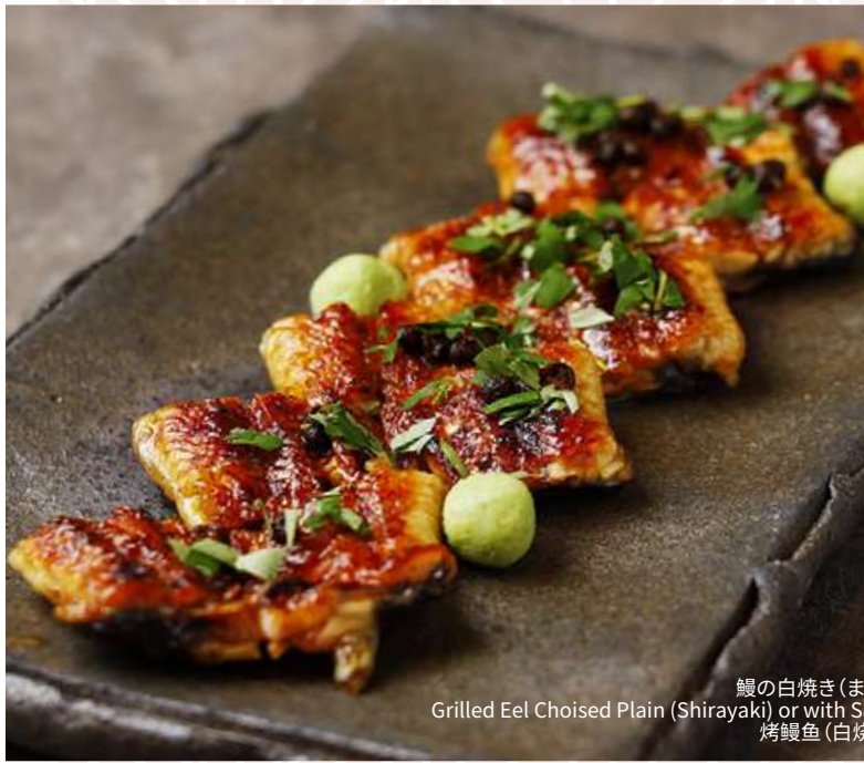
鰻の白焼き(または山椒焼き) Grilled Eel Choiced Plain (Shirayaki) or with Sansho Pepper 烤鰻鱼(白烧 或 山椒风味)