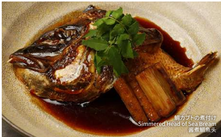
鯛カブトの煮付け Simmered Head of Sea Bream 酱煮鯛魚头