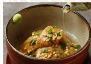
鯛茶漬け Sea Bream Sashimi over Rice in Dashi Broth 茶泡鲷鱼饭