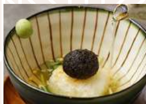
焼きおにぎり茶漬け Grilled Onigiri (Rice Ball) in Dashi Broth 茶泡烤饭团