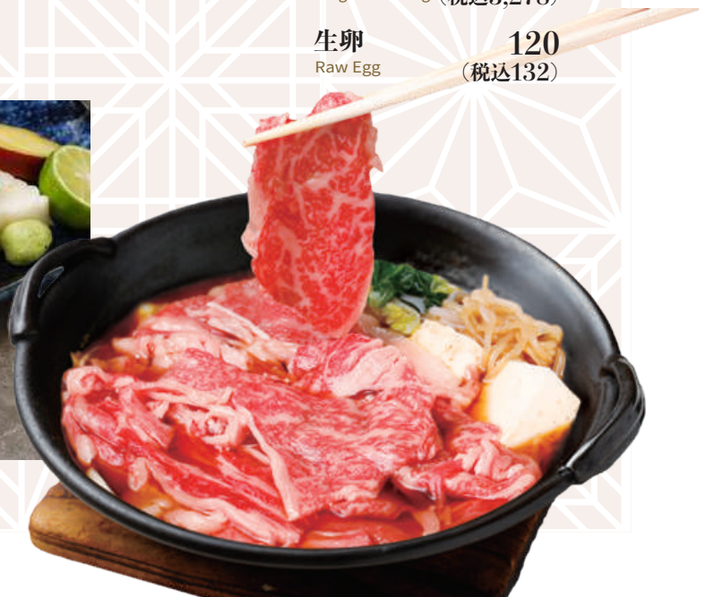
黒毛和牛のすき焼き Black Wagyu Beef Sukiyaki 黒毛和牛寿喜烧(生鸡蛋1个)