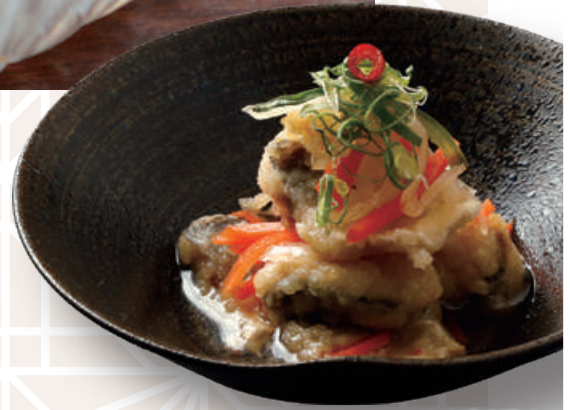
アジ南蛮漬け Marinated Fried Horse Mackerel (Nanban Style) 南蛮風味腌竹荚鱼