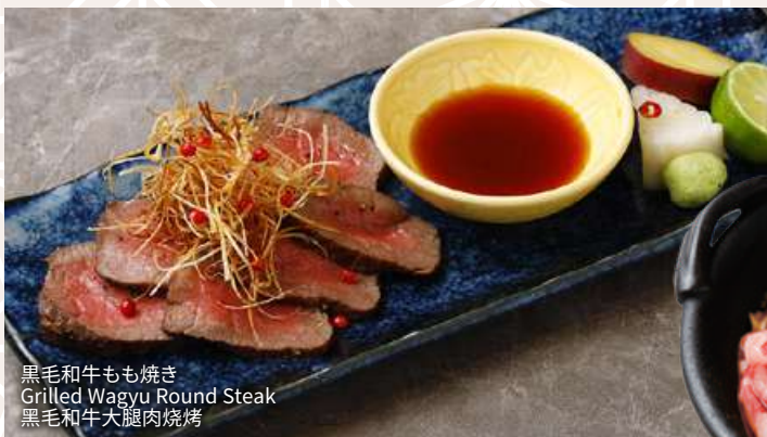
黒毛和牛もも焼き Grilled Wagyu Round Steak 黒毛和牛大腿肉烧烤