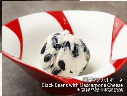
黒豆マスカルポーネ Black Beans with Mascarpone Cheese 黒豆拌马斯卡邦尼奶酪