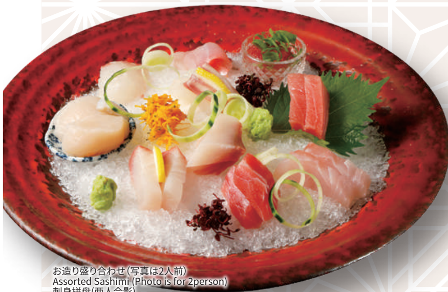
お造り盛り合わせ(写真は2人前) Assorted Sashimi (Photo is for 2person) 刺身拼盘(两人合影)

We offer a separate handout with explanations of unique Japanese food terms used in our menu, especially for non-Japanese guests. Please feel free to ask our staff if you'd like a copy.