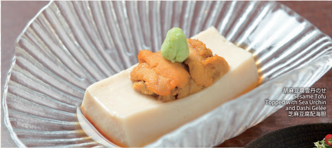
胡麻豆腐雲丹のせ Sesame Tofu Topped with Sea Urchin and Dashi Gelée 芝麻豆腐配海胆