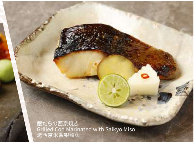
銀だらの西京焼き Grilled Cod Marinated with Saikyo Miso 烤西京米酱银鳕鱼