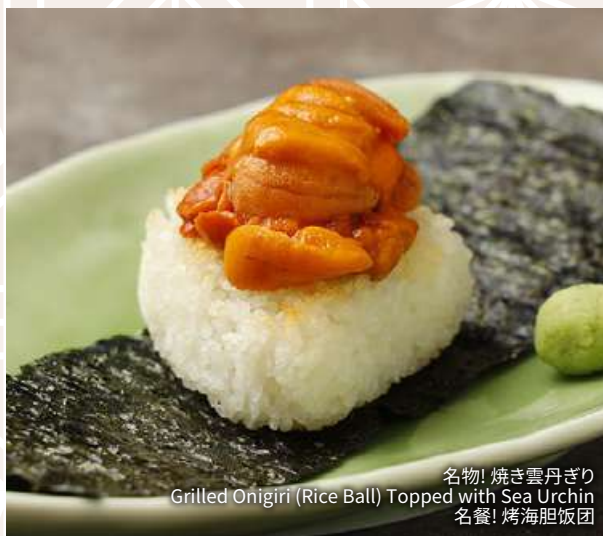
名物! 焼き雲丹ぎり Grilled Onigiri (Rice Ball) Topped with Sea Urchin 名餐! 烤海胆饭团