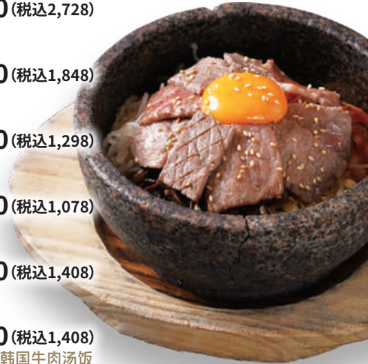
松阪牛石焼きビビンバ Hot Stone Bibimbap with Matsusaka beef 松阪牛石锅拌饭