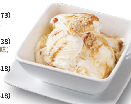
俺の焼肉アイス Vanilla Ice Cream with Roasted Soybean Flour 香草烤黄豆粉冰淇淋