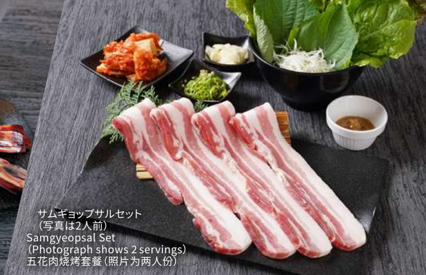
サムギョップサルセット (写真は2人前) Samgyeopsal Set (Photograph shows 2 servings) 五花肉烧烤套餐 (照片为两人份)

※すべてのお肉は、必ず中心部まで加熱して、火の通りを確認してお召し上がりください。 ※Please make sure to cook all meat thoroughly and check that it is cooked through before eating. ※所有肉类均应煮至中心位置，以确保熟透。