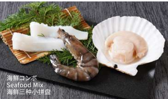
海鮮コンボ Seafood Mix 海鮮三種小拼盘

んにくラー油焼き 780 (税込858) Grilled Garlic with Chili Oil / 辣椒油烤蒜