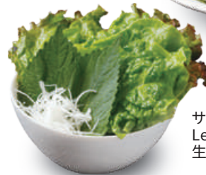
サンチュ盛り合せ Lettuce for Lapped 生菜叶