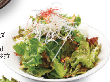
塩胡麻チョレギサラダ Salt and Sesame Korean Style Salad 盐和芝麻韩式生菜沙拉