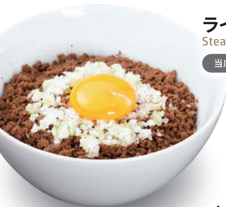
そぼろご飯 Seasoned minced beef over Steamed Rice 牛肉燥饭