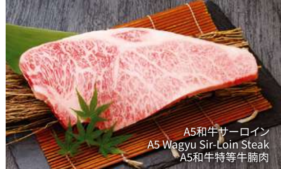
A5和牛サーロイン A5 Wagyu Sir-Loin Steak A5和牛特等牛腩肉