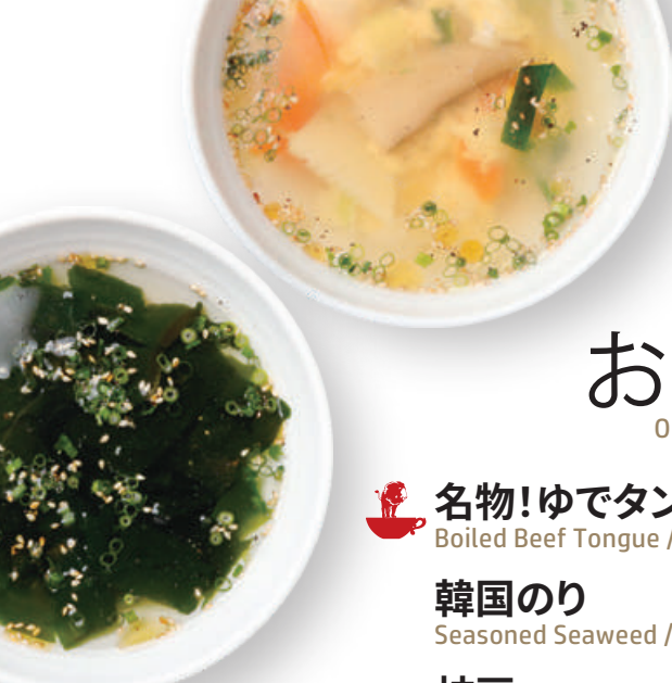
たまごスープ Egg Soup 鸡蛋汤