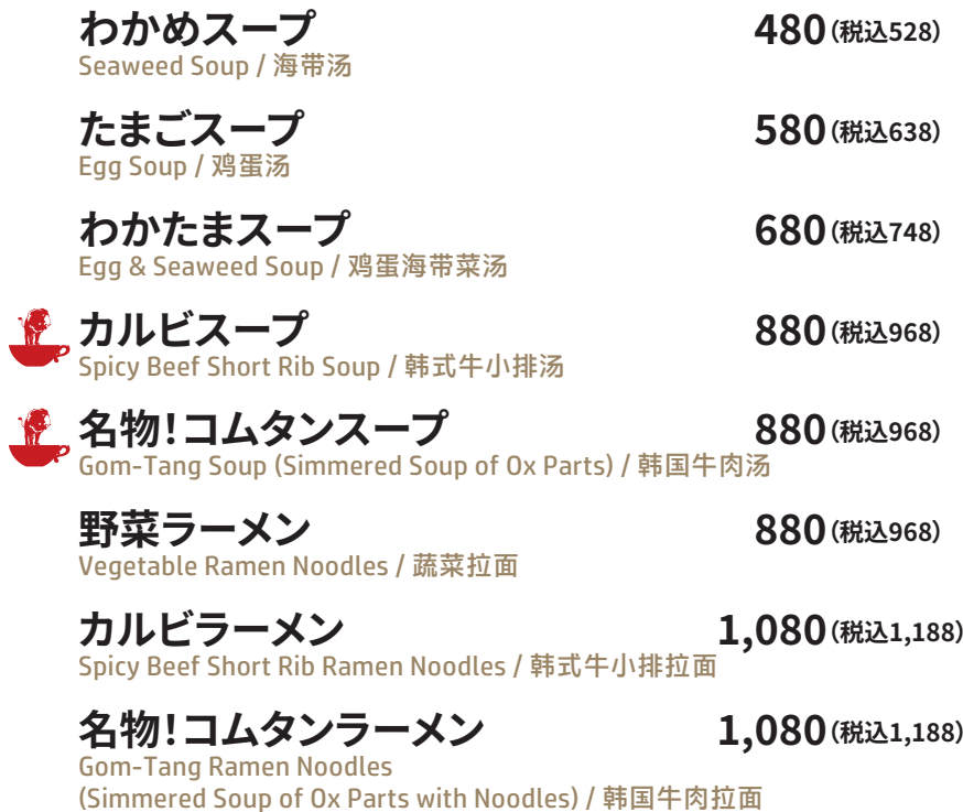
カルビスープ Spicy Beef Short Rib Soup 韩式牛小排汤