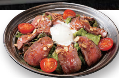
自家製! 和牛ローストビーフサラダ Roasted Wagyu Beef Salad 烤牛肉沙拉

サンチュ盛り合せ 780 Lettuce for Lapped / 生菜叶 (税込858)