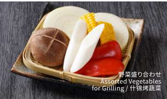
野菜盛り合わせ Assorted Vegetables for Grilling / 什锦烤蔬菜

※写真はイメージです Image is for illustration purposes / 图片仅供参考