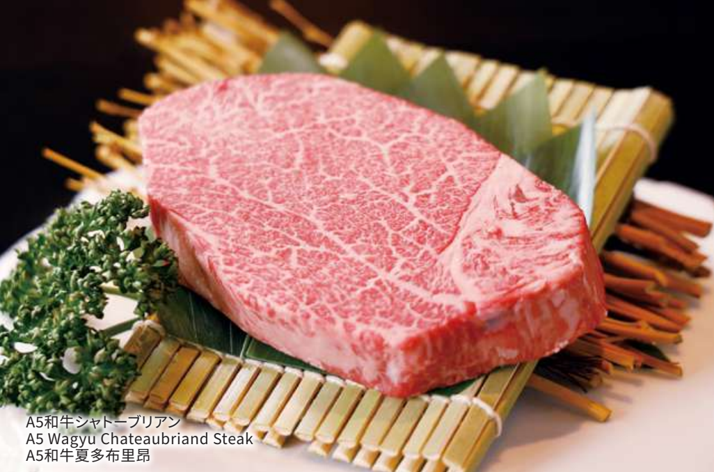
A5和牛シャトーブリアン A5 Wagyu Chateaubriand Steak A5和牛夏多布里昂