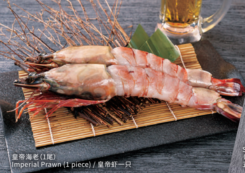
皇帝海老 (1尾) Imperial Prawn (1 piece) / 皇帝虾一只