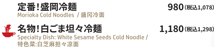
白ごま坦々冷麺 White Sesame Seeds Cold Noodle 白芝麻坦々冷面