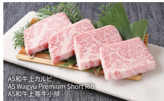
A5和牛上カルビ A5 Wagyu Premium Short Rib A5和牛上等牛小排