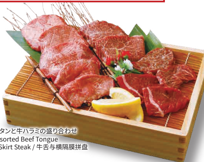
牛タンと牛ハラミの盛り合わせ Assorted Beef Tongue & Skirt Steak / 牛舌与横隔膜拼盘

Assorted Beef Tongue & Skirt Steak / 牛舌与横隔膜拼盘 4,780(税込5,258)