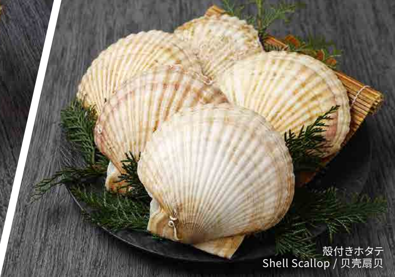
殻付きホタテ Shell Scallop / 贝壳扇贝

※すべてのお肉は、必ず中心部まで加熱して、火の通りを確認してお召し上がりください。 ※Please make sure to cook all meat thoroughly and check that it is cooked through before eating. ※所有肉类均应煮至中心位置，以确保熟透。