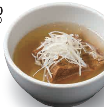
名物!ゆでタン Boiled Beef Tongue 水煮牛舌