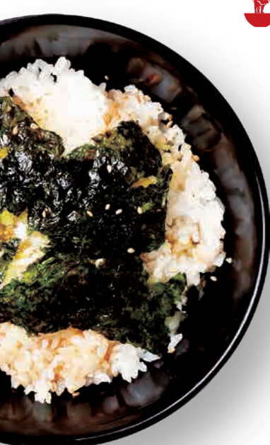
焼肉専用ご飯 Yakiniku Sauce, Rice, Diced Leek and Seaweed 特制烤肉酱、葱花、 芝麻、与海苔碎