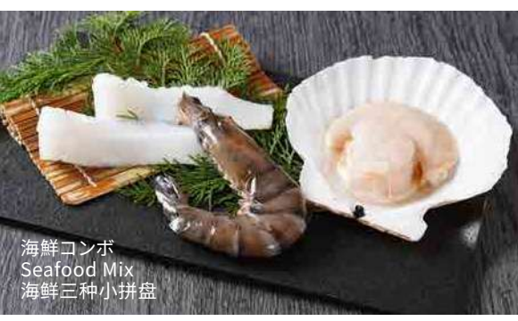
海鮮コンボ Seafood Mix 海鮮三種小拼盘