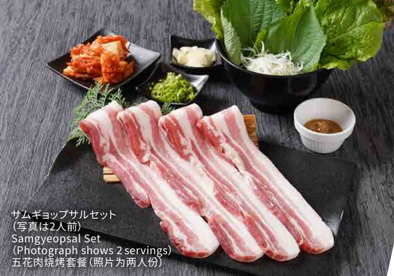
サムギョップサルセット (写真は2人前) Samgyeopsal Set (Photograph shows 2 servings) 五花肉烧烤套餐(照片为两人份)