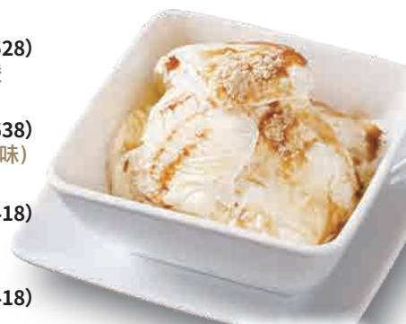
俺の焼肉アイス Vanilla Ice Cream with Roasted Soybean Flour 香草烤黄豆粉冰淇淋