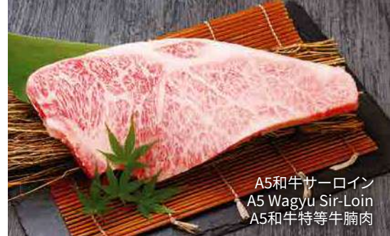
A5和牛サーロイン A5 Wagyu Sir-Loin A5和牛特等牛腩肉