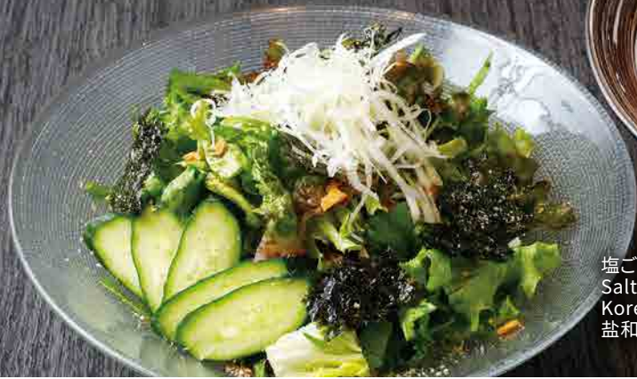
塩ごまチョレギサラダ Salt and Sesame Korean Style Salad 盐和芝麻韩式生菜沙拉