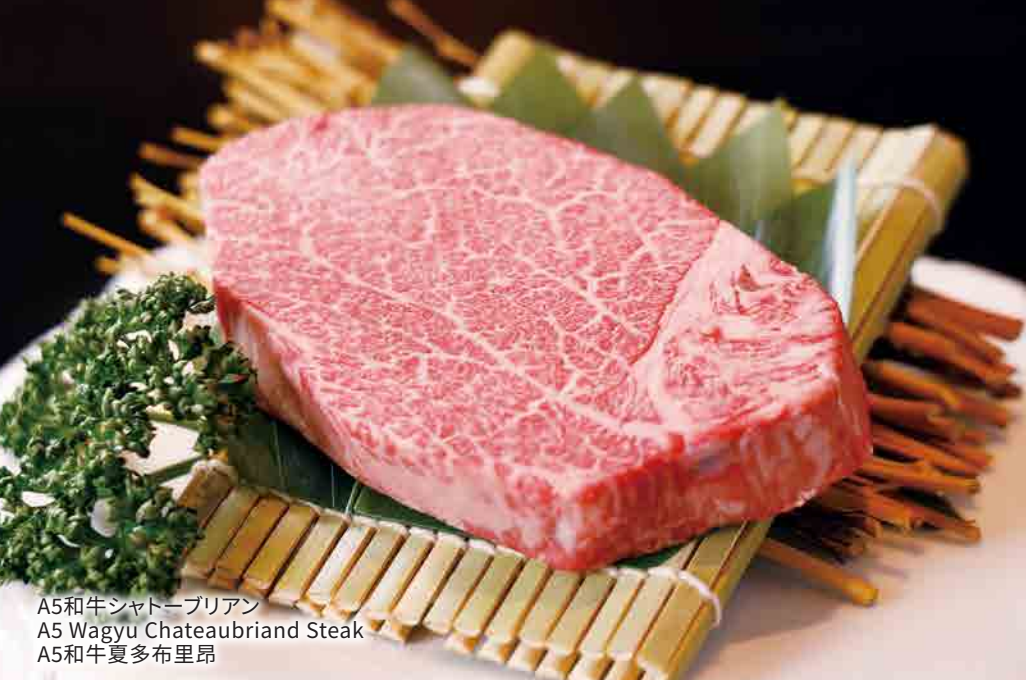
A5和牛シャトーブリアン A5 Wagyu Chateaubriand Steak A5和牛夏多布里昂