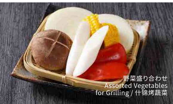
野菜盛り合わせ Assorted Vegetables for Grilling / 什锦烤蔬菜

※写真はイメージです Image is for illustration purposes / 图片仅供参考