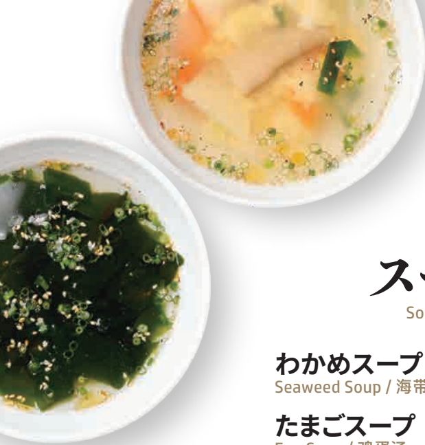
たまごスープ Egg Soup 鸡蛋汤