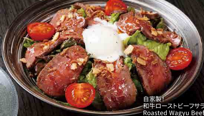
自家製! 和牛ローストビーフサラダ Roasted Wagyu Beef Salad 烤牛肉沙拉

※写真はイメージです Image is for illustration purposes 图片仅供参考