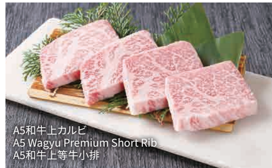
A5和牛上カルビ A5 Wagyu Premium Short Rib A5和牛上等牛小排