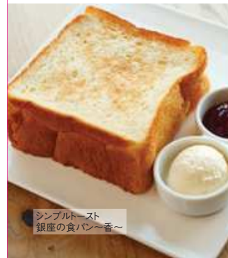
シンプルトースト 銀座の食パン〜香〜

全てのメニューに トッピングOK! 海老フライ FRIED SHRIMP 278円 アレルギー物質 小麦 卵 海老 (税込価格300円)