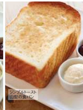
シンプルトースト 山型の食パン

当店定番の食パンを使ったトースト。 ミルクの自然な甘み特徴の「銀座の食パン〜香〜」と、トーストのための食パン「山型の食パン」の いずれかをお選びいただけます。 いちごジャムとホイップバターの2種類のトッピング でお召し上がりください。