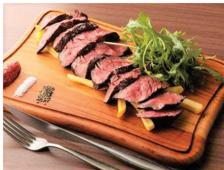
ブラックアンガス牛の サーロインステーキ Beef Steak with French Fries ¥1780