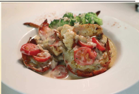
数量 限定 オマール海老まるごとロースト マリニエールソース ¥1980 残ったソースに追加で！青海苔リゾット Risotto in the Sauce Finish ¥380