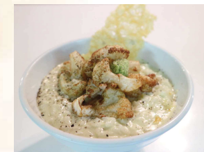
ワサビのチーズリゾット Wasabi Cheese Risotto ¥680