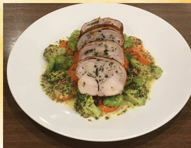
ウサギ背肉のオリーブ詰めロースト たっぷり春野菜の粒マスタードソース Olive Stuffed Rabbit Roast ¥1280

おすすめ 本日の鮮魚 その日の仕立てで Today's Fish Today's Style ¥1380