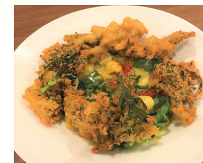
春菊とじゃがいものニョッキ アンチョビ風味のソース Syungiku and Potato Gnocchi ¥780