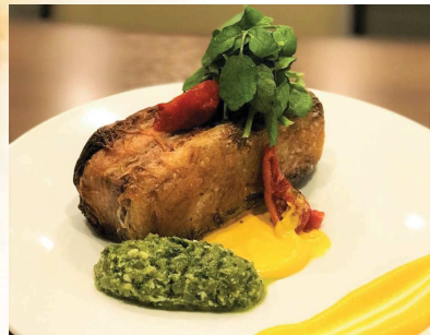
香ばしいポテトで包んだ雪室熟成ポーク ラビゴットソース添え Snow Aged Pork Covered with Potato Savory ¥1480