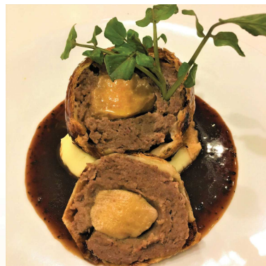
牛ひき肉とフォアグラのパイ包み ペリグーソース Grounded Beef and Foie Gras Pie ¥1780