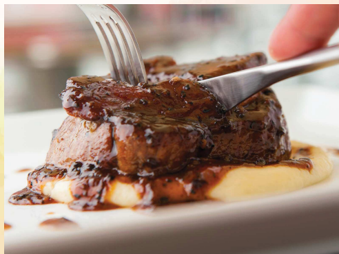
名物！牛フィレ肉とフォアグラのロッシーニ "Rossini" Grilled Beef Filled and Sauteed Foie Gras ¥1980