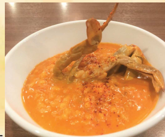
おすすめ ワタリガニのトマトクリームリゾット Blue Crab Risotto with Tomato Cream ¥680