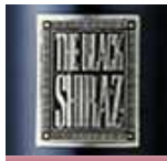
バートン・ヴィンヤーズ シラズ ¥1,980

原産国:イタリア 品 種:メルロ タイプ:ミディアム・辛口 アルコールのボリューム感を感じさせてないスムーズな飲み口。カシスの香りとスパイスなど魅力的な香り。