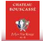
シャトー・ブスカッセ モン・ヴァン・ルージュ ¥2,980

原産国:フランス 品 種:サンソー タイプ:フルボディ・辛口 パリのピストロの定番ワイン。 赤い果実とスパイスの風味が上品な味わい。