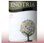
エノトリアレッド ¥2,980

原産国:イタリア 品 種:シラー タイプ:ミディアムボディ・辛口 シチリア産の濃くて美しいルビー色。柔らかな飲み心地と程よいボディ。トマトベースのバスタや肉料理と。