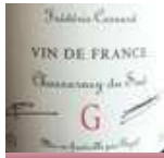
シャノルネイ・ド・シュッド キュヴェG ¥3,980

原産国:オーストラリア 品 種:ピノ・ノワール タイプ:ミディアムボディ・辛口 ブドウ本来の美味しさを表現した非常に綺麗なワイン ブルゴーニュワインを彷彿させる深みとエレガンス。