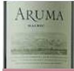
カロ・アルマ マルベック ¥3,980

原産国:フランス 品 種:ピノ・ノワール タイプ:ミディアムボディ・辛口 ピレネー山脈の冷涼な環境からなる心地よい酸味。果実味とのバランスの取れたワイン。