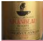
グランボーレゼルブ カベルネ・シラー ¥1,980

原産国:フランス 品 種:カベルネ・ソーヴィニオン、シラー タイプ:ミディアムフル・辛口 ジュースでジャムのような凝縮感のある味わい。俺のシリーズのソムリエ50人が選んだザ・ハウスワイン。