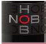
ホブノブ ピノ・ノワール ¥2,980

原産国:チリ 品 種:メルロ、カベルネ・ソーヴィニオン タイプ:フルボディ・辛口 エレガントなチリワインの代表各「エラスリス」。なめらかで豊かな味わいでフレンチオーク樽からくる奥行きのある味わい。