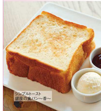
シンプルトースト 銀座の食パン〜香〜