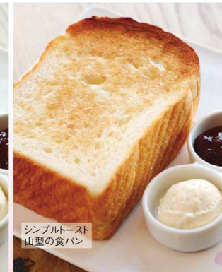
シンプルトースト 山型の食パン

当店定番の食パンを使ったトースト。 ミルクの自然な甘みが特徴の「銀座の食 パン〜香〜」と、トーストのための食パン 「山型の食パン」のいずれかをお選びい ただけます。 いちごジャムとホイップバターの2種類の トッピングでお召し上がりください。