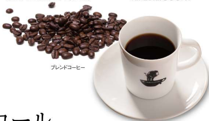
ブレンドコーヒー