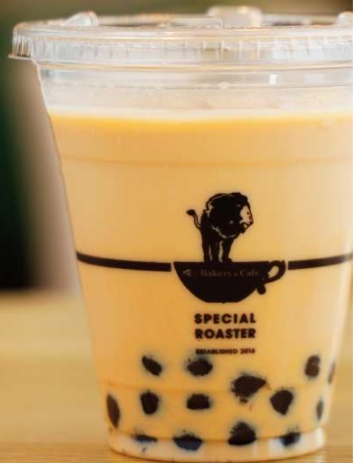
タピオカマンゴーミルク TAPIOCA MANGO MILK 630 円 (税込価格680円)