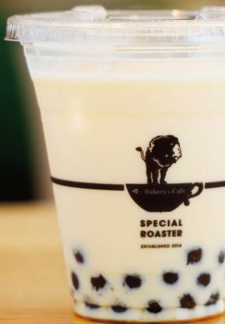
タピオカミルクティー TAPIOCA MILK TEA 630 円 (税込価格680円)