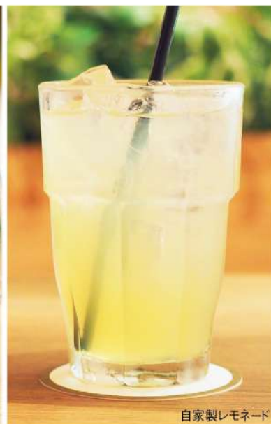
自家製レモネード