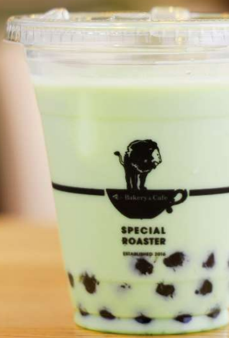
タピオカ抹茶ミルク TAPIOCA MATCHA MILK 630 円 (税込価格680円)