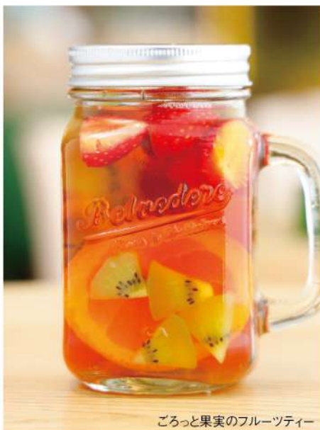
ごろっと果実のフルーツティー