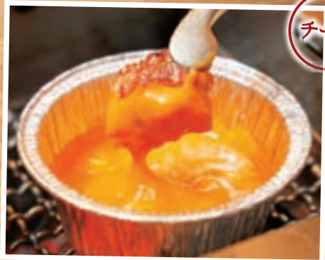
中落ちカルビ (100g) 680 RIB FINGER WITH CHEESE