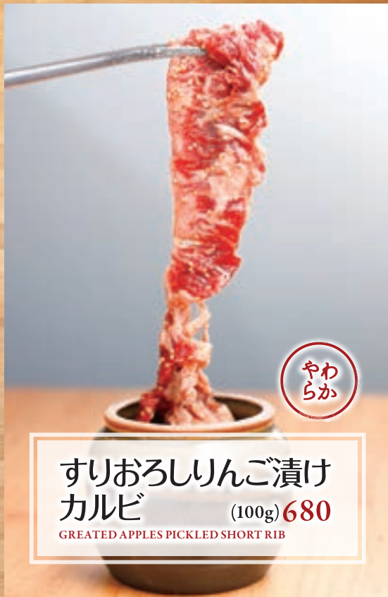
すりおろしりんご漬け カルビ (100g) 680 GREATED APPLES PICKLED SHORT RIB