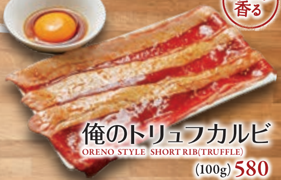
俺のトリュフカルビ ORENO STYLE SHORT RIB (TRUFFLE) (100g) 580