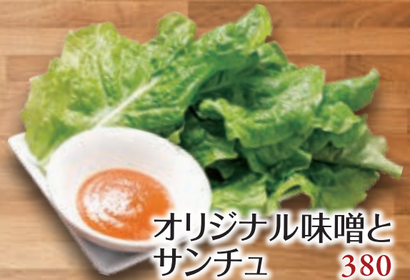
オリジナル味噌と サンチュ 380