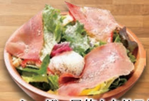
シーザー風俺んちサラダ