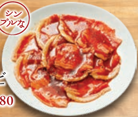
カルビ SHORT RIB (100g) 280