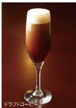
ドラフトコーヒー

窒素ガスを使って作ったクリーミーな泡立ちは、まるで黒ビールのよう。 苦みを抑え、コーヒー本来の美味しさを味わえる、特別なアイスコーヒーです。