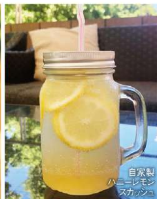
自家製 ハニーレモン スカッシュ