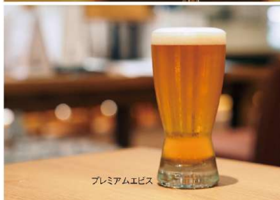
プレミアムエビス

「俺の」シリーズの名物ワイン。在籍するソムリエ50名で厳選したハウスワインを“なみなみ”に注いでご提供いたします。