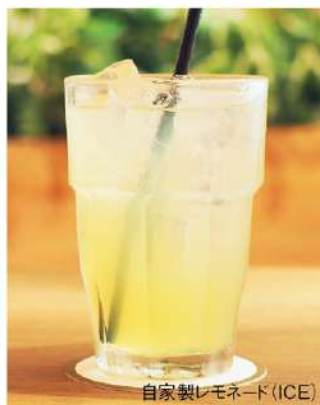
自家製レモネード(ICE)