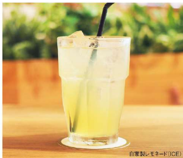
自家製レモネード(ICE)