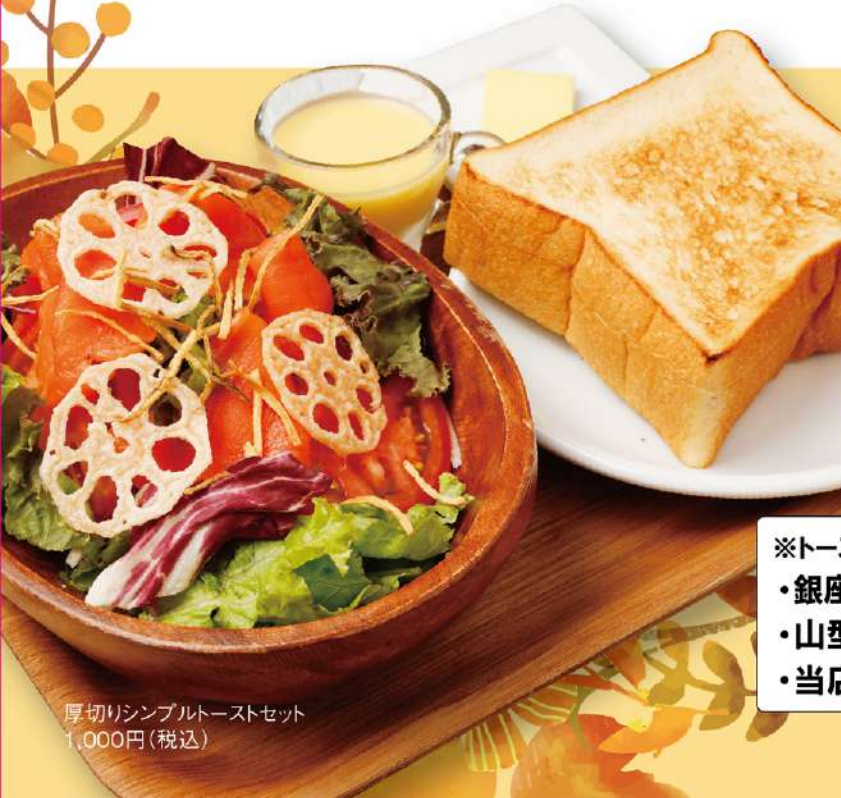
厚切りシンプルトーストセット 1,000円(税込)