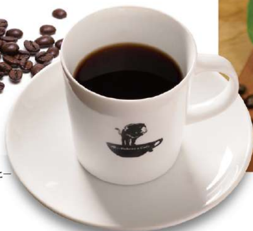
ブレンドコーヒー