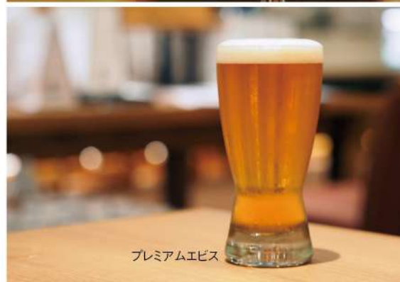
プレミアムエビス

「俺の」シリーズの名物ワイン。在籍するソムリエ50名で厳選したハウスワインを“なみなみ”に注いでご提供いたします。