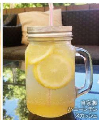
自家製 ハニーレモン スカッシュ