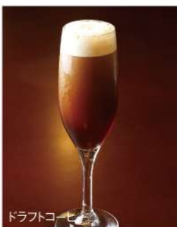
ドラフトコーヒー

窒素ガスを使って作ったクリーミーな泡立ちは、まるで黒ビールのよう。 苦みを抑え、コーヒー本来の美味しさを味わえる、特別なアイスコーヒーです。