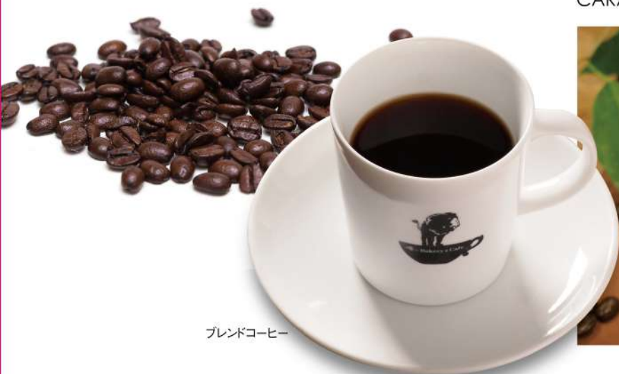
ブレンドコーヒー