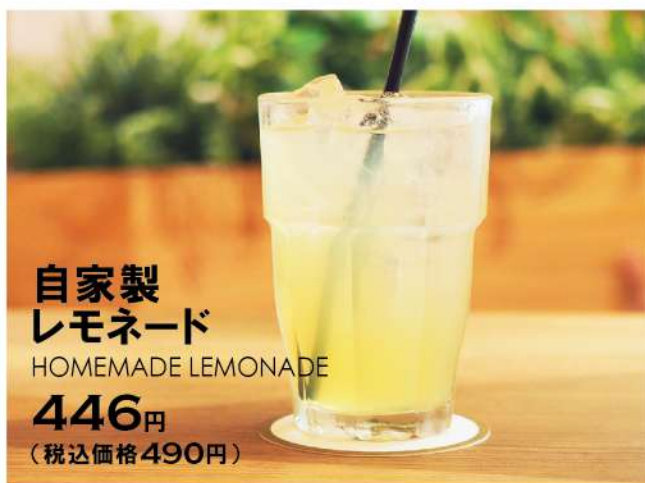
自家製 レモネード HOMEMADE LEMONADE 446円 (税込価格490円)