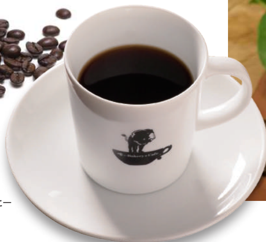
ブレンドコーヒー