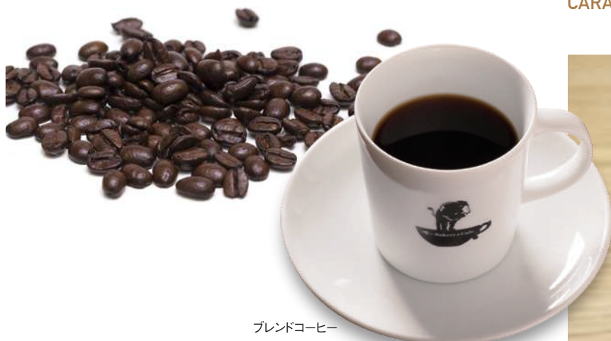
ブレンドコーヒー