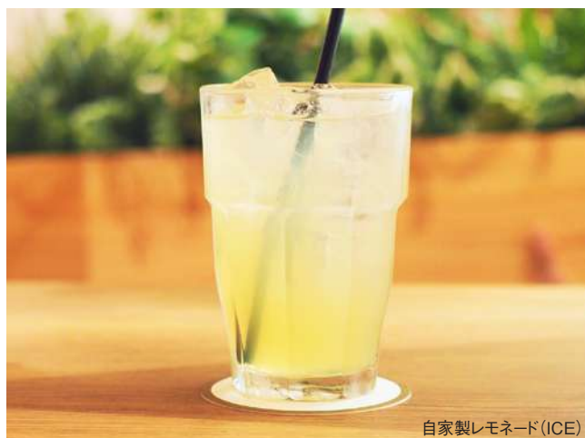
自家製レモネード(ICE)