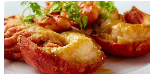
オマール海老の丸ごとソテー