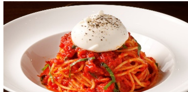
ブッラータチーズを乗せたトマトソース