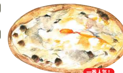
一番人気! ピザ・ビスマルク