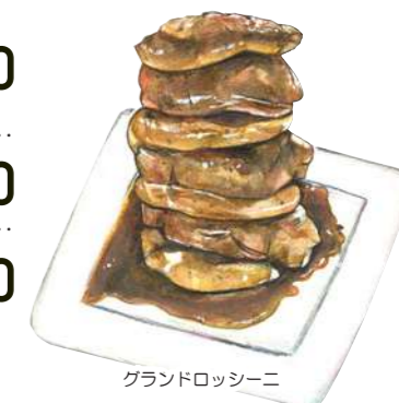
グランドロッシーニ