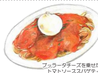
ブルータチーズを乗せた トマトソーススパゲティ