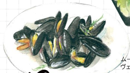
ムール貝の ヴェルモット蒸し