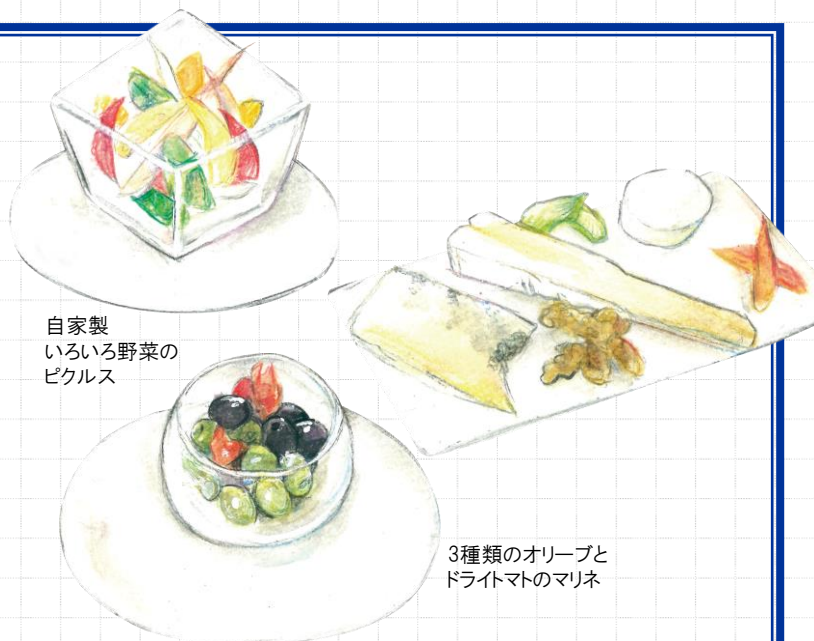
自家製 いろいろ野菜の ピクルス

フルーツマトのコンポート 480 Compote of Fruit tomato (税込528)