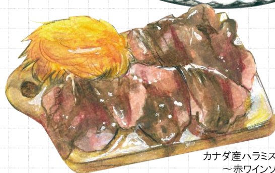
カナダ産ハラミステーキ ~赤ワインソース~