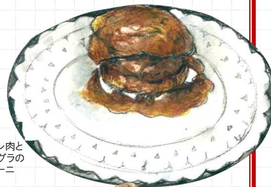
牛フィレ肉と フォアグラの ロッシーニ

カナダ産“活け”オマール海老のロースト 2,480 Roasted fresh Lobster from Canada (税込2,728)