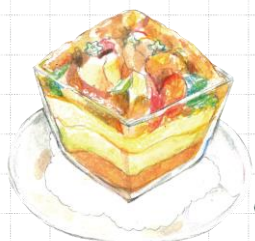
海の幸と野菜の宝石箱 (イラストはイメージです)

鮮魚のカルパッチョ 780 Carpaccio of Fresh fishes (税込858)