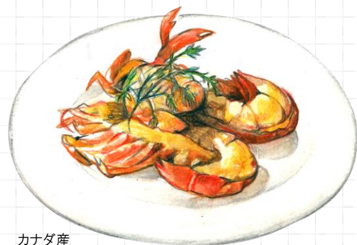
カナダ産 "活け"オマール海老のロースト