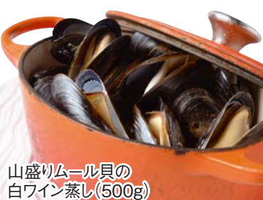
山盛りムール貝の 白ワイン蒸し(500g)