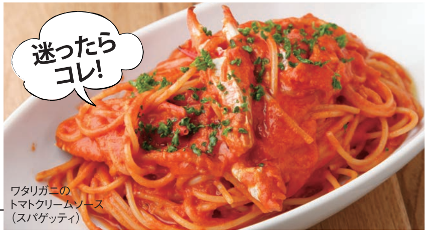
ワタリガニの トマトクリームソース (スパゲッティ)