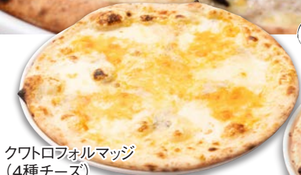
クワトロフォルマッジ (4種チーズ)