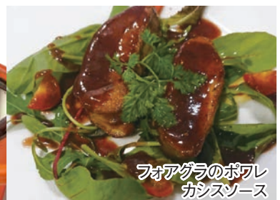
フォアグラのポワレ カシスソース