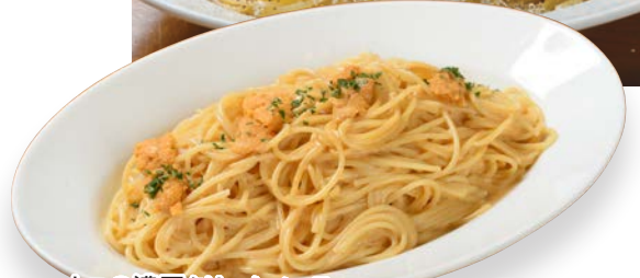
ウニの濃厚クリームソース (スパゲッティ)