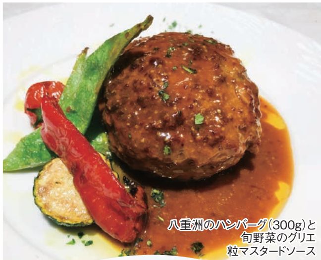
八重洲のハンバーグ(300g)と 旬野菜のグリエ 粒マスタードソース