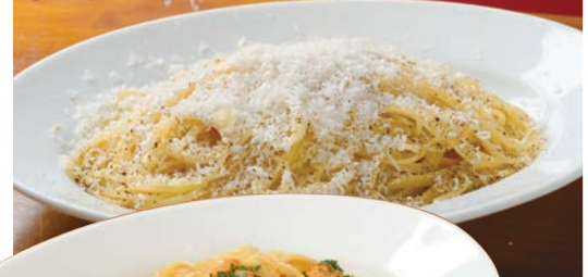
イタリアン賄いパスタ カチョ エ ペペ (スパゲッティ)

フォアグラとトリュフのリゾット 1,180 Risotto of Foir gras and Truffle