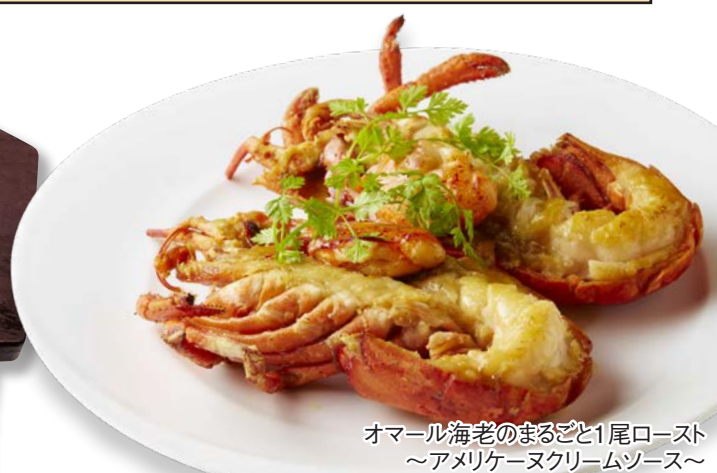
オマール海老のまるごと1尾ロースト ~アメリカンクリームソース~

トッピング フォアグラ・ソテー(60g) +600 Topping Sauteed Foie gras