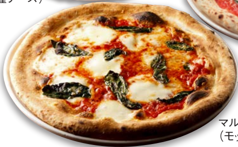
マルゲリータ (モッツアレラ・バジル)