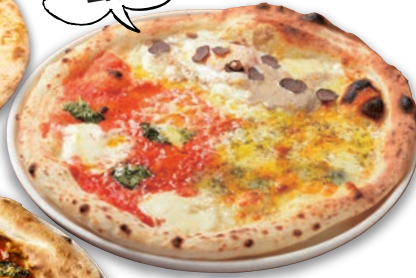
俺の欲張りピッツァ (ビスマルク・4種類チーズ・ マルゲリータ)