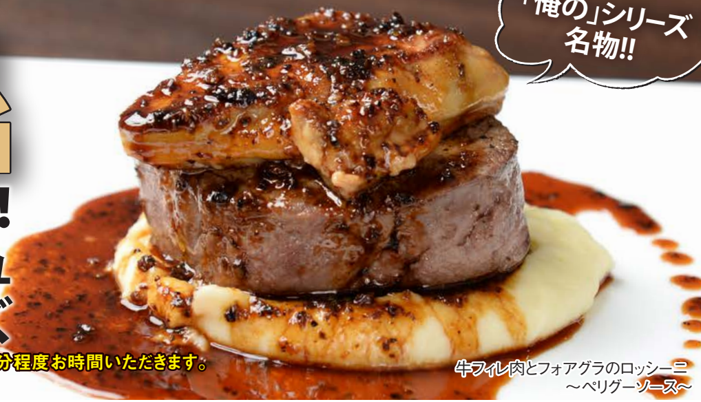
牛フィレ肉とフォアグラのロッシーニ ~ペリゲーソース~