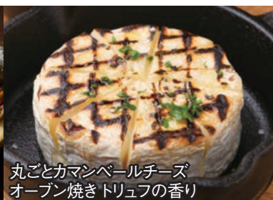
丸ごとカマンベールチーズ オープン焼きトリュフの香り