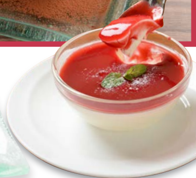
パンナコッタ ベリーのソース