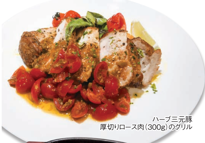
ハーブ三元豚 厚切りロース肉(300g)のグリル