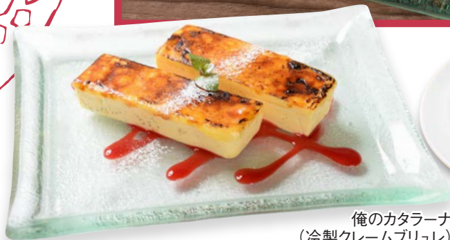
俺のカタラーナ (冷製クレームブリュレ)