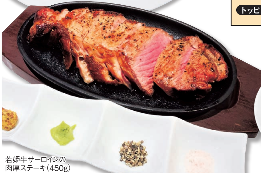
若姫牛サーロインの 肉厚ステーキ(450g)