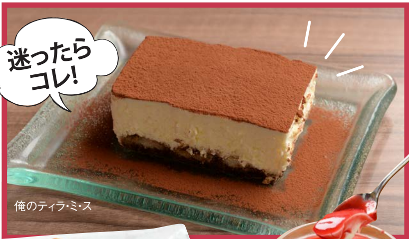
俺のティラ・ミス