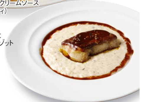
フォアグラと トリュフのリゾット