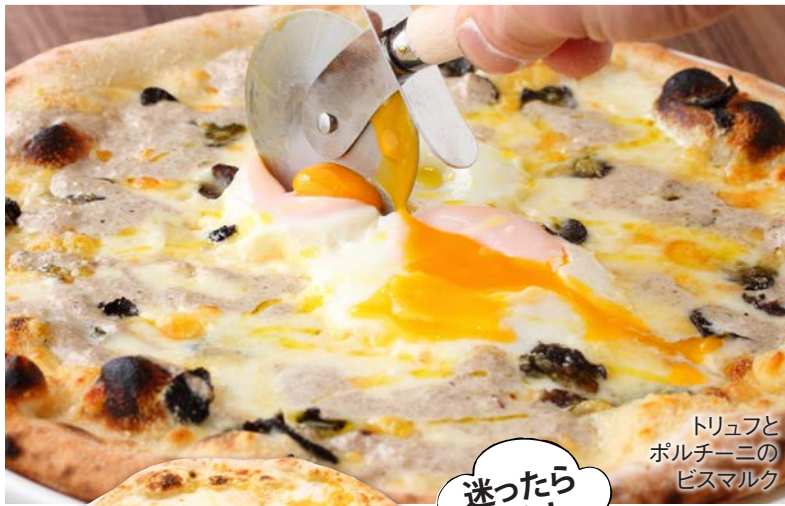
トリュフと ポルチーニの ビスマルク

(ビスマルク・4種類チーズ・マルゲリータ) 3 kinds of Mixed pizza (Bismarck, 4 Cheese, Margherita)