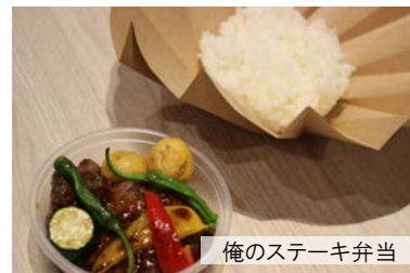
俺のステーキ弁当