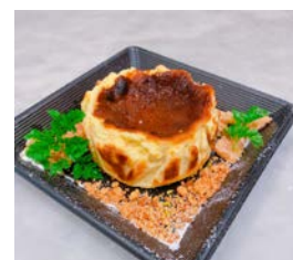
バスクチーズケーキ