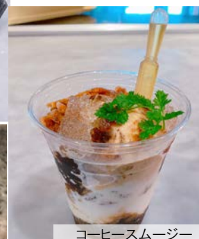
コーヒースムージー