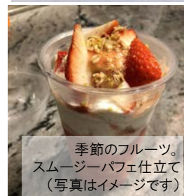
季節のフルーツ。 スムージーパフェ仕立て (写真はイメージです)