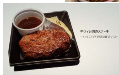
牛フィレ肉のステーキ →トリュフとマディラ酒の贅沢ソース