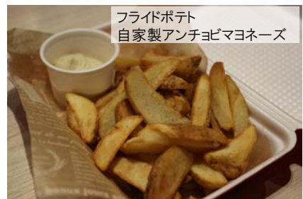
フライドポテト 自家製アンチョビマヨネーズ