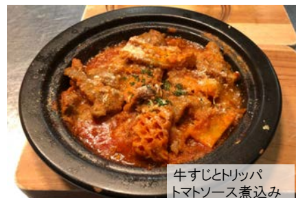
牛すじとトリッパ トマトソース煮込み