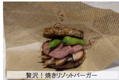
贅沢！焼きリゾットバーガー