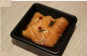
スモークサーモン