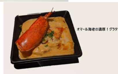
オマール海老の濃厚！グラタン