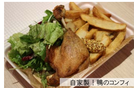
自家製！鴨のコンフィ