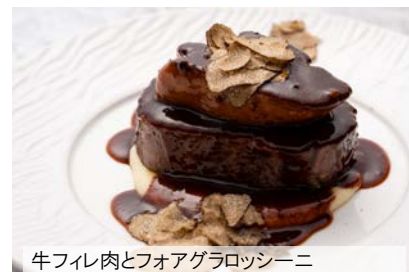
牛フィレ肉とフォアグラロッシーニ