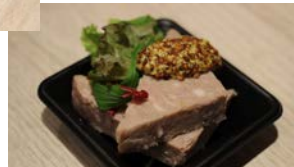
パテ・ド・カンパーニュ