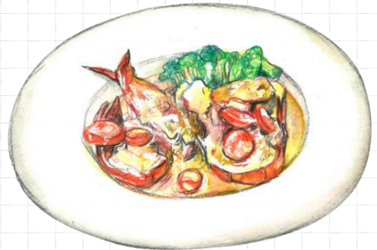
オマール海老丸ごと1尾のロースト