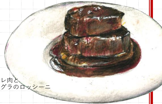
牛フィレ肉と フォアグラのロッシーニ