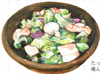
たっぷり! 俺んちサラダ