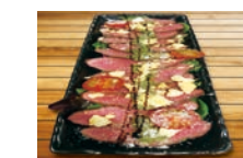
牛タンのグリル カルパッチョ風 1,180円