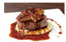
★ロッシェニ風ステーキ 2,980円