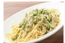
本日の ペペロンチーノ 980円