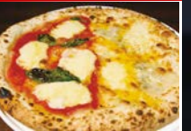
ハーフ&ハーフ (マルゲリータ& クワトロフォルマッジ) 1,080円