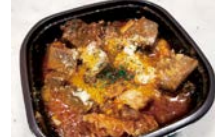
丸腸とトリッパの 辛いトマト煮込み 880円