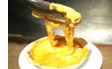
チーズとボロネーゼの スパゲティグラタン "ホルケーノ" 780円