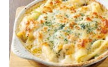
★カニ・エビ・ホタテ のシーフードグラタン 980円