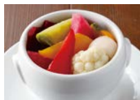
★自家製ピクルス 380円