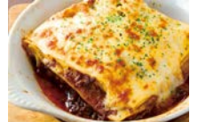
★お肉たっぷり ラザーニャ 980円