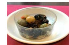
★オリーブマリネ 380円