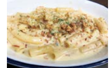
ゴルゴンゾーラ とベーコンの クリームパスタ 880円