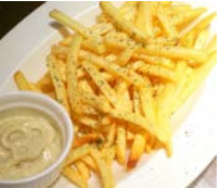
★アンチョビマヨネーズの フライドポテト 480円