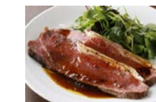
U.S産サーロインの ローストビーフ 150g 1,680円 300g 2,380円