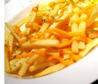
★チーズとろける フライドポテト 580円