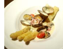
★ホワイトアスパラ・ アサリのマリニエール 680円