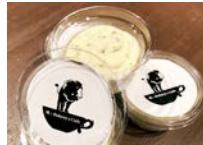
★自家製 トリュフバター1個 300円

※こちらのメニューは平日の17:30~22:00 土・日・祝の12:00~22:00のご提供となります。