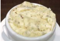
トリュフ香る マッシュポテト 480円