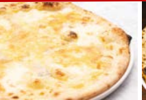
クワトロ フォルマッジ 980円