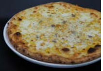
クレマディマイス 880円