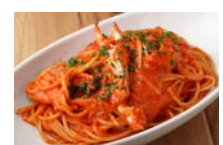
渡り蟹のトマト クリームパスタ 980円