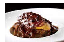
フォアグラをのせた 牛ホホ肉の赤ワイン煮 込み 1,880円