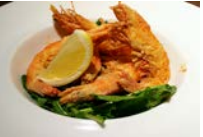
★ソフトシェルシュリンプ のセモリナフリット 680円