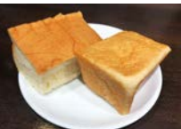
★銀座の食パ「香」 1カット 150円