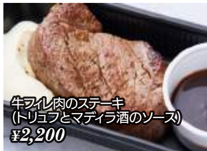
牛フィレ肉のステーキ (トリュフとマディラ酒のソース) ¥2,200