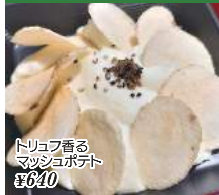
トリュフ香る マッシュポテト ¥640