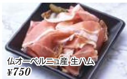
仏オーベルニヨ産 生ハム ¥750