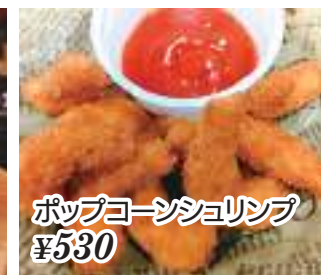
ポップコーンシュリンプ ¥530