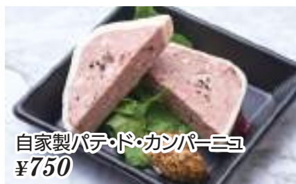
自家製パテ・ド・カンパーニヨ ¥750