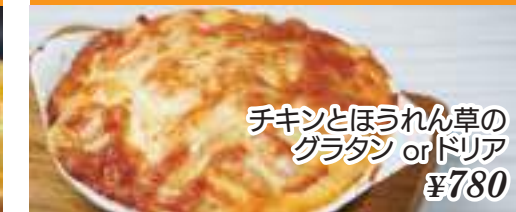
チキンとほうれん草の グラタン or ドリア ¥780