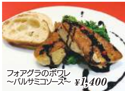
フォアグラのポフレ ~バルサミコンソース~ ¥1,400