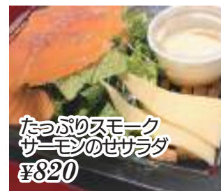
たっぷりスモーク サーモンのせサラダ ¥820