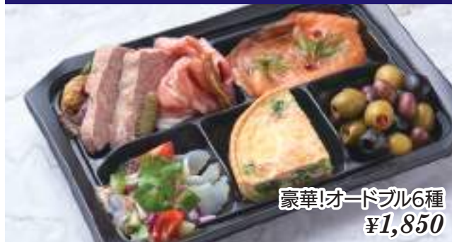
豪華!オードブル6種 ¥1,850