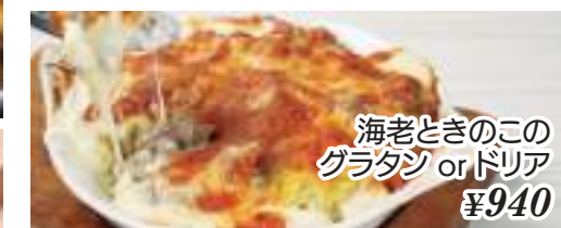
海老ときのこの グラタン or ドリア ¥940