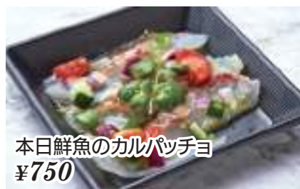
本日鮮魚のカルパッチョ ¥750