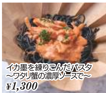
イカ墨を練りこんだパスタ ~ワタリ蟹の濃厚ソースで~ ¥1,300