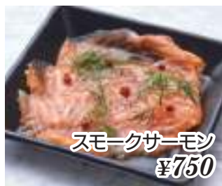
スモークサーモン ¥750