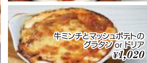
牛ミンチとマッシュポテトの グラタン or ドリア ¥1,020