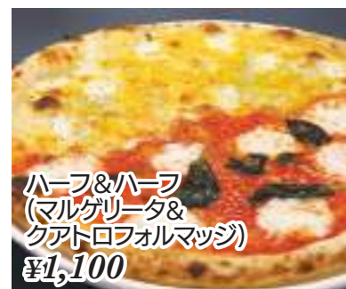
ハーブ&ハーブ (マルゲリータ& クアトロフォルマッジ) ¥1,100