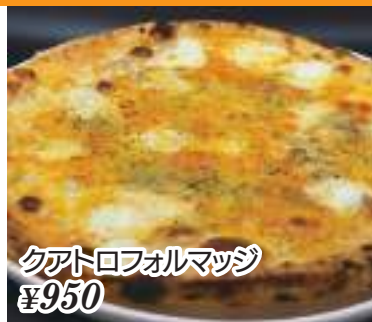
クアトロフォルマッジ ¥950