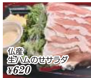
仏産 生ハムのせサラダ ¥620