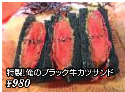
特製!俺のブラック牛カツサンド ¥980