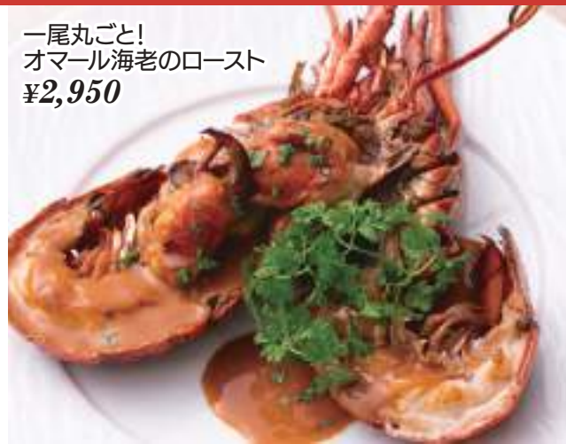
一尾丸ごと! オマール海老のロースト ¥2,950