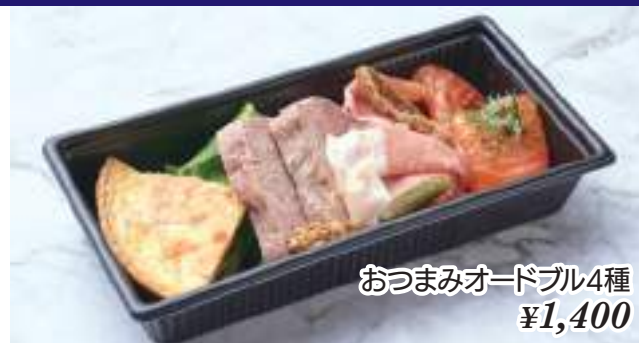
おつまみオードブル4種 ¥1,400