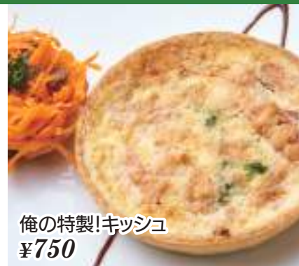
俺の特製!キッシュ ¥750