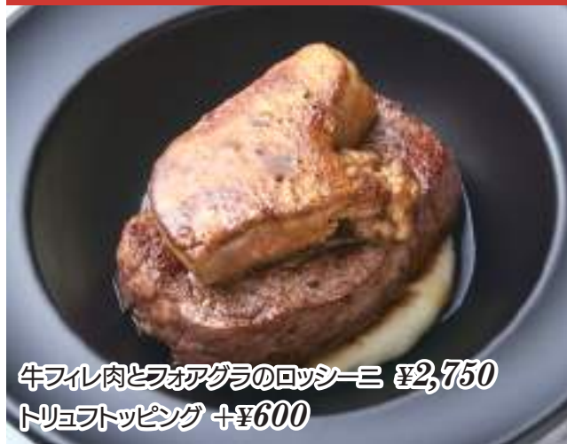
牛フィレ肉とフォアグラのロッシュニ ¥2,750 トリュフトッピング +¥600