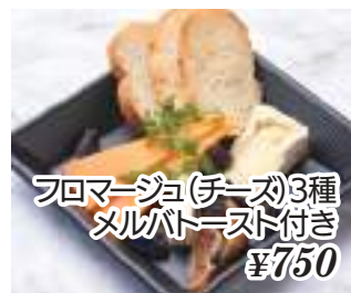
フロマージュ(チーズ)3種 タルパトースト付き ¥750