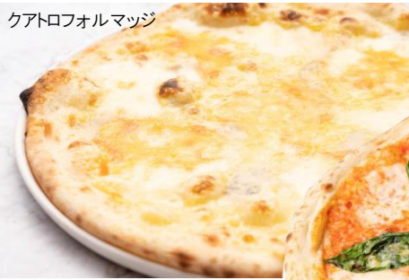
クアトロフォルマッジ