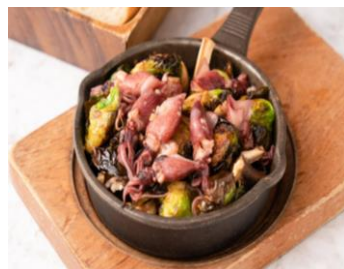
アヒージョ (写真はイメージです)