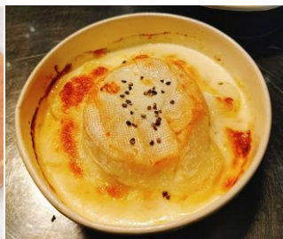
カマンベールチーズと ジャガイモのグラタン