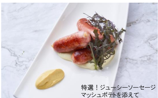
特選! ジューシーソーセージ マッシュポテトを添えて