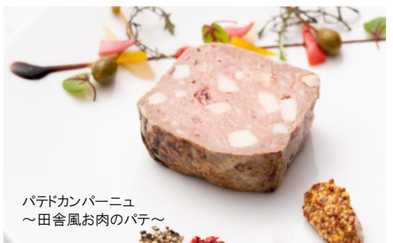
パテドカンパーニュ ～田舎風お肉のパテ～