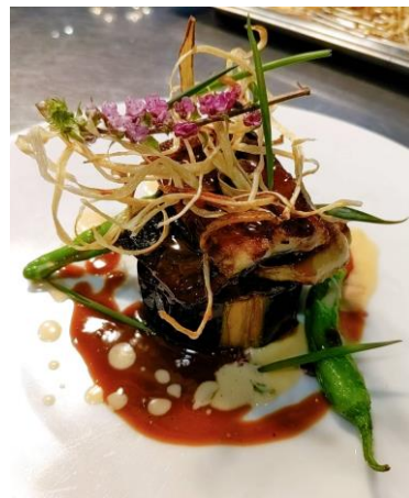
米茄子とウナギ、フォアグラ ロッシェニ仕立て 山椒風味のポルトソース