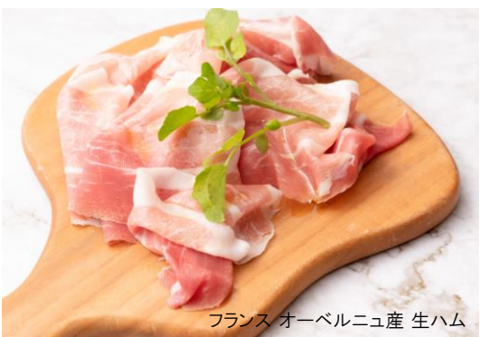
フランス オーベルニュ産 生ハム