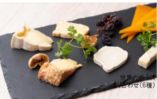
世界のチーズ 盛り合わせ(6種)