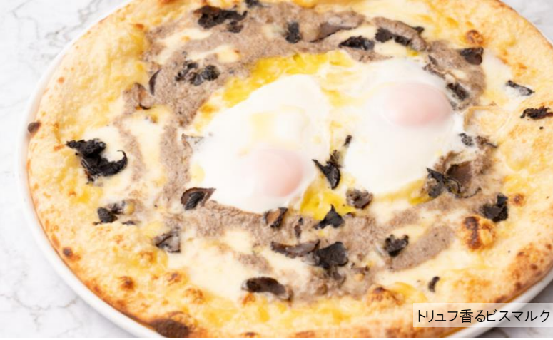
トリュフ香るビスマルク