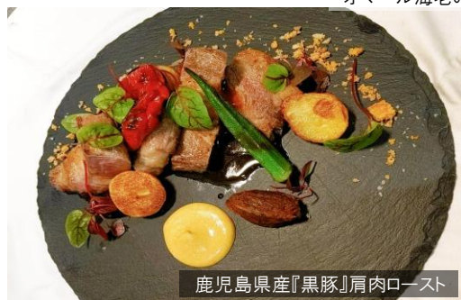
鹿児島県産『黒豚』肩肉ロースト