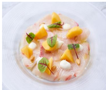
カルパッチョ(写真はイメージです)