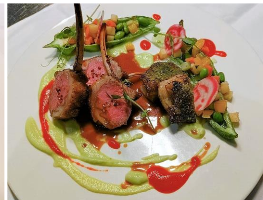
仔羊骨付きロースの炭火焼