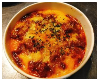
挽肉とジャガイモのオープン焼 「アッシパルマンティエ」