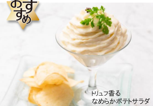
トリュフ香る なめらかポテトサラダ