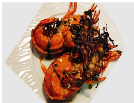
オマール海老の丸ごとロースト