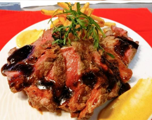
1ポンド！牛サーロインステーキ