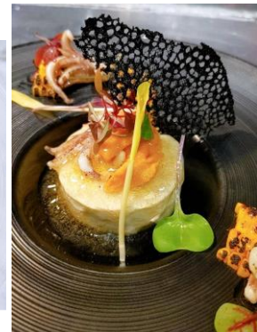
トウモロコシのムース 生ウニ、コンソメジュレかけ