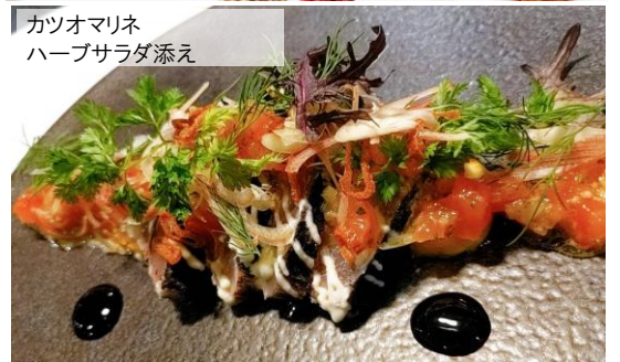
カツオマリネ ハーブサラダ添え