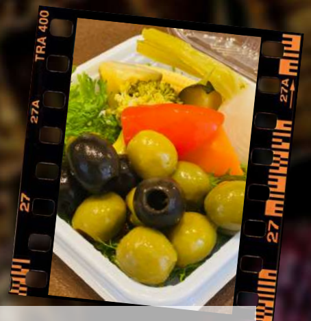
オリーブ&ピクルス 580円