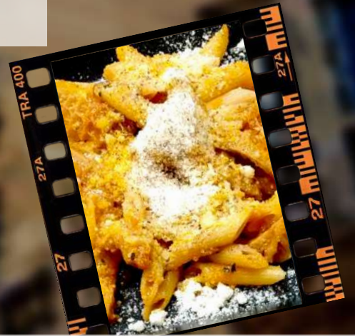
トリュフとパコネアラビアーノ ガーリックチーズ 1,180円