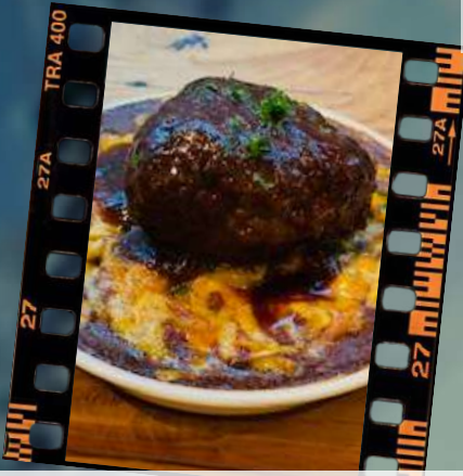
ハンバーグカレードリア 1,280円