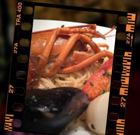
オマール海老を使ったバスカトーレ 1,580円