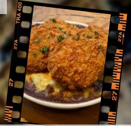
豚ヒレ1口カツカレードリア 1,180円