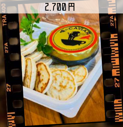
瓶ごと!! キャビア 甘コークリーム添え 2,700円