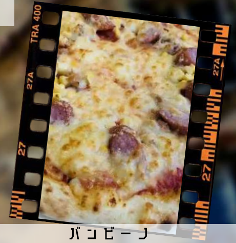
パコビーノ (コココ・ツチ・ソーセージ) 880円