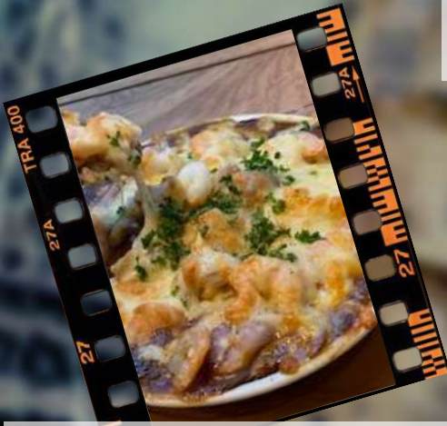
シーフードカレードリア 1,380円