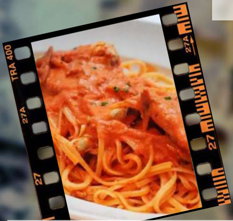
渡り蟹のトマトクリームバス 980円