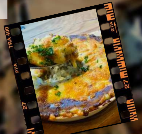
ダブルチーズカレードリア 880円