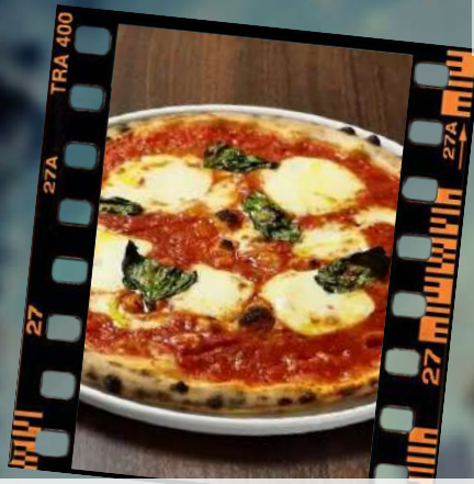
「俺の」定番！マルガリータ 880円