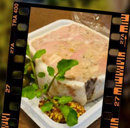
バター・ド・カコーニ 780円