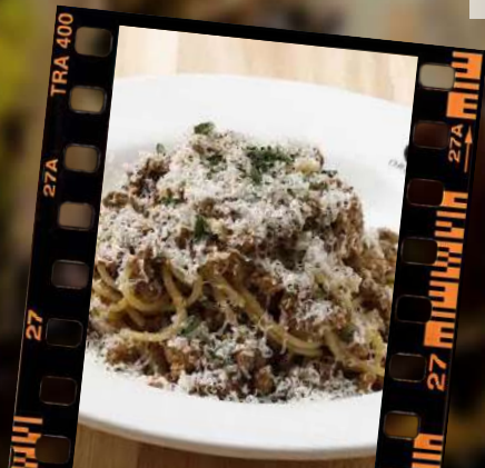
大人のミートソース (ボロネーゼ) 1,080円