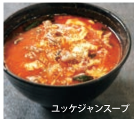
ユッケジャンスープ