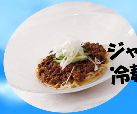
ジャージャー 冷麺 880円