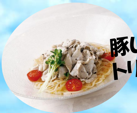
豚しゃぶ トリュフ冷麺 1380円