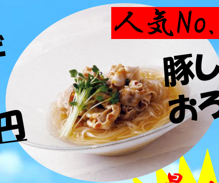
豚しゃぶ おろし冷麺 1280円