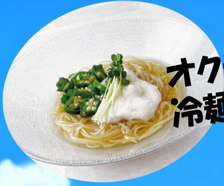
オクラとろろ 冷麺 980円