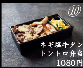
ネギ塩牛タン トントロ弁当 1080円