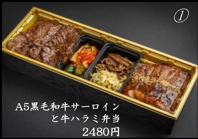
A5黒毛和牛サーロイン と牛ハラミ弁当 2480円