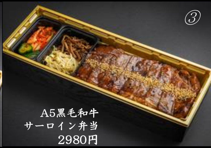
A5黒毛和牛 サーロイン弁当 2980円