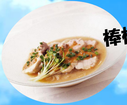
棒棒鶏風 冷麺 1180円