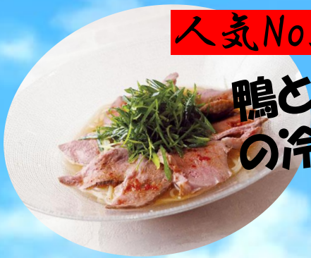
鴨と九条ネギ の冷麺 1280円