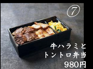
牛ハラミと トントロ弁当 980円