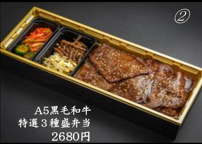
A5黒毛和牛 特選3種盛弁当 2680円