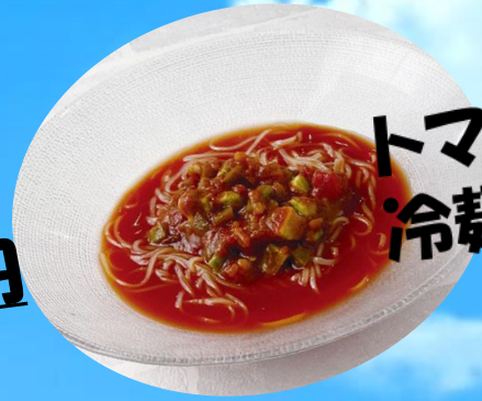
トマトサルサ 冷麺 1280円