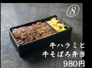
牛ハラミと 牛そぼろ弁当 980円