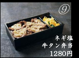
ネギ塩 牛タン弁当 1280円