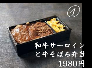
和牛サーロイン と牛そぼろ弁当 1980円