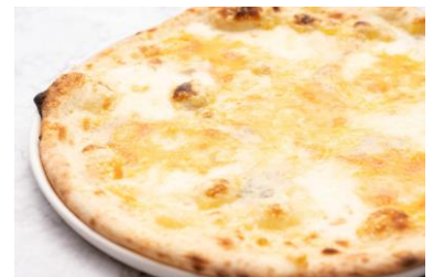
クアトロフォルマッジ