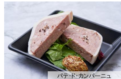
パテ・ド・カンパーニュ