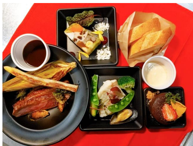
フレンチコースセット(写真はお一人前です。)