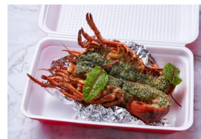
イセエビのヴァプール