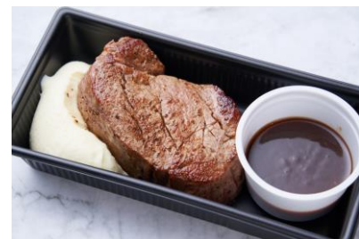
牛フィレステーキ