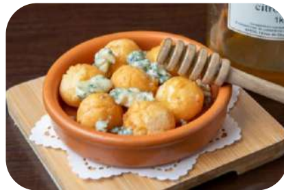
フォカッチャとブルーチーズ