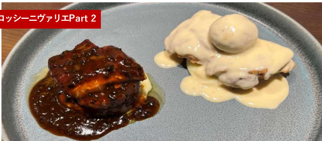
鶏もも肉のフリキャセ (クリーム煮) &牛フィレ肉とフォアグラのロッシーニ (牛フィレ肉75g+フォアグラ25g)

Braised young chicken with cream& Beef filet steak and foie gras "Rossini" style with truffle sauce (100g)