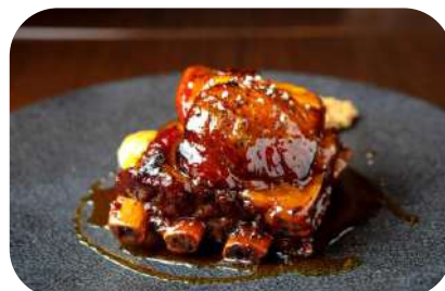
豚スペアリブのキャラメリゼ