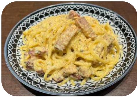
イベリコベーコンとトリュフのカルボナーラ