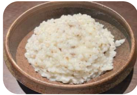
トリュフのリゾット