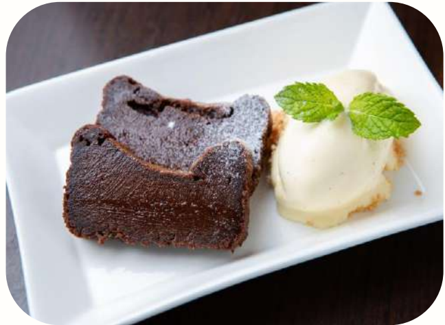
濃厚テリーヌ・ド・ショコラ&バニラアイス Rich terrine de chocolat & vanilla ice cream