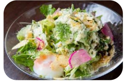
俺のフレンチサラダ