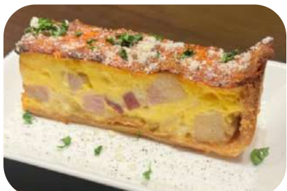
キッシュロレーヌ