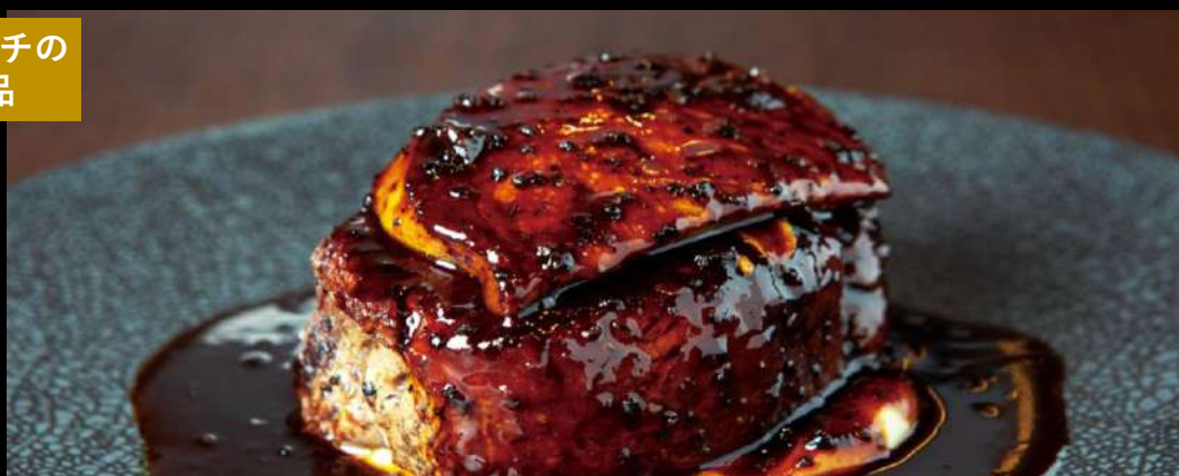
牛フィレ肉とフォアグラのロッシーニ(牛フィレ150g+フォアグラ50g)

Beef filet steak and foie gras "Rossini" Style with truffle sauce (200g)