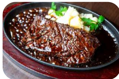
バベット (牛ハラミ) のステーキ

Spécialité 骨付き鴨もも肉のコンフィ～Parisのビストロスタイル～ 1,680(税込1,848) Confit duck leg