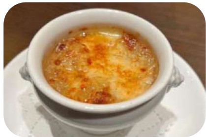
オニオングラタンスープ