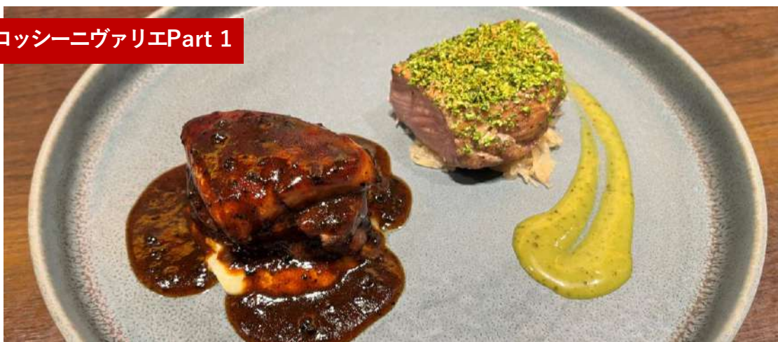
豚肩ロースのブレゼ 香草パン粉焼き &牛フィレ肉とフォアグラのロッシーニ (牛フィレ肉75g+フォアグラ25g)

Breze of pork shoulder baked in herbed bread crumbs& Beef filet steak and foie gras "Rossini" style with truffle sauce (100g)