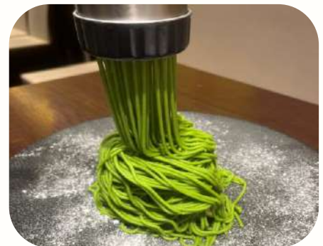
季節のモンブラン 今月は抹茶クリームで Seasonal Mont Blanc