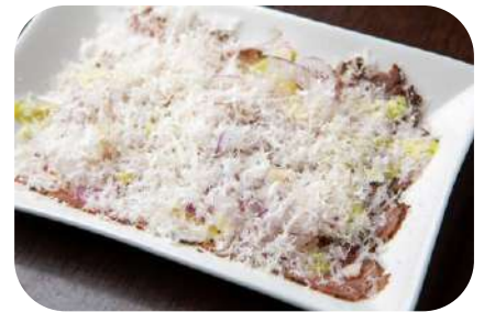
冷製ローストビーフ