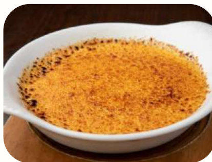
バニラたっぷり！ 王道のクレームブリュレ Classic creme brulee with Filling vanilla