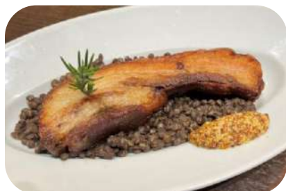
イベリコ豚バラ肉のブレゼ