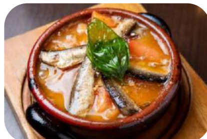
シェフの気まぐれアヒージョ