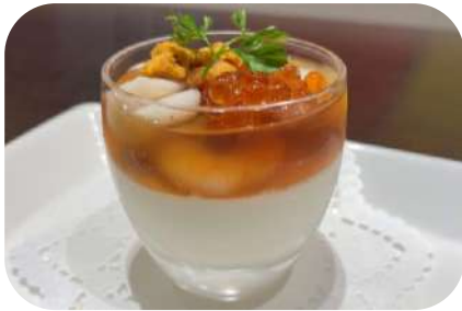
海老・帆立・雲丹・イクラのジュレ