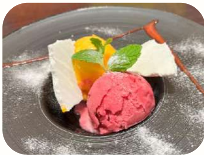
シンプルに！ 2種のアイスクリーム Two kinds of ice cream