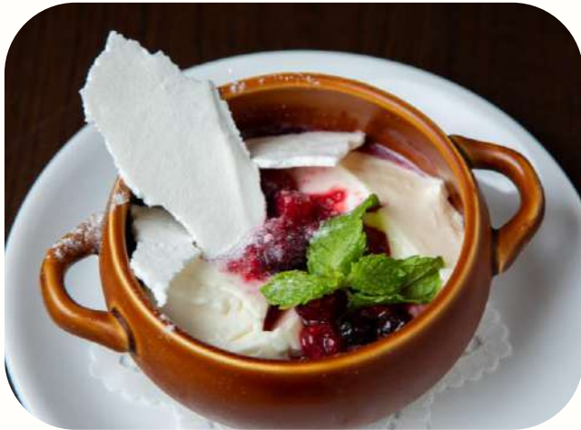
ブランマンジェ&ミックスベリーソース Blancmange & mixed berry sauce