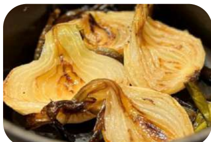
オニオンヌーボーのロースト