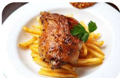
骨付き鴨もも肉のコンフィ