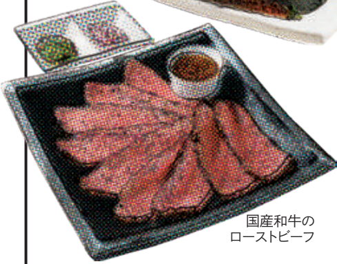
国産和牛の ローストビーフ