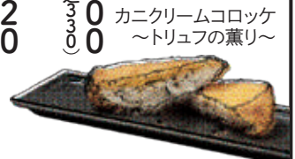
カニクリームコロッケ ~トリュフの薫り~

大判トロトロ豚角煮馬鈴薯館 Large tender pork cubes with Potato Paste mixed in dashi soup / 大块嫩猪肉配土豆酱 (税込1180)