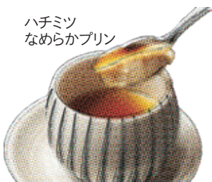
ハチミツ なめらかプリン

ハチミツなめらかプリン 420 Honey pudding / 蜂蜜布丁 (税込462)