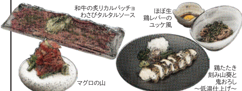
ほぼ生鶏レバーのユッケ風 やみつき! よだれ鶏 カツオの和風カルパッチョ マグロの山 和牛の炙りカルパッチョ わさびタルタルソース 鶏たたき 刻み山葵と 鬼おろし ~低温仕上げ~

厚切りオーロラサーモンのサラダ 玉葱と西京味噌ドレッシング Thick-cut Aurora salmon salad with Onion and Sake miso dressing / 厚片极光三文鱼沙拉配洋葱和西京味噌酱 (税込1380)