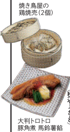
焼き鳥屋の鶏焼売(2個) 大判トロトロ 豚角煮 馬鈴薯館