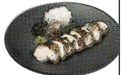
鶏たたき刻み山葵と鬼おろし ~低温仕上げ~

焼き鳥屋の鶏焼売(2個) 380 Chicken Siu Mai Dumplings / 鶏肉焼売 (税込418)