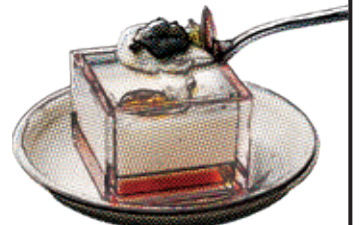
山芋のカクテル キヤビア添え

山芋の和風ムース キヤビアとワサビを添えて 620 Japanese-style Mountain Yam mousse with caviar and wasabi / 山芋和風慕斯配 合キヤビアとワサビ添え