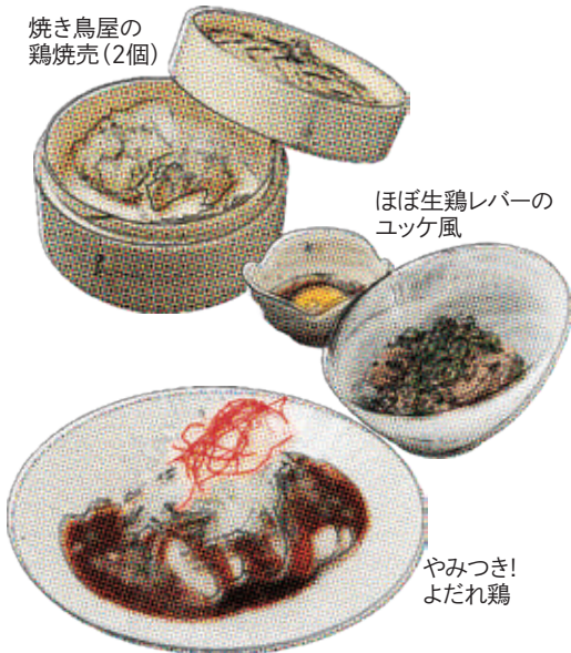
やみつき! よだれ鶏