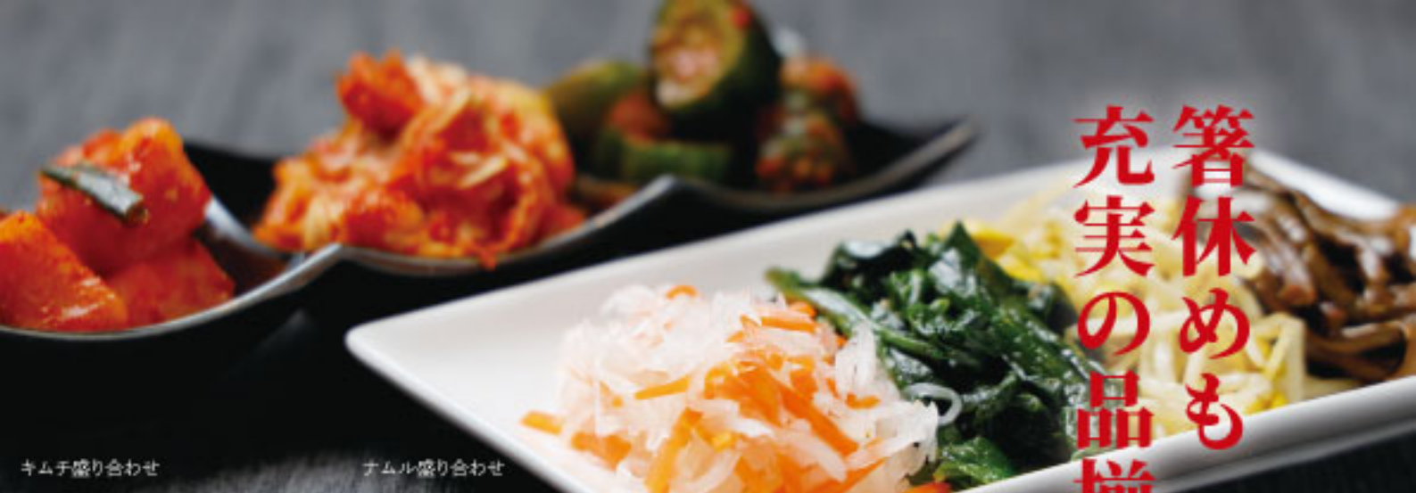
キムチ盛り合わせ