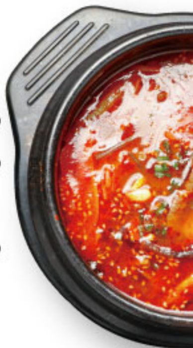
ユッケジャンクッパ