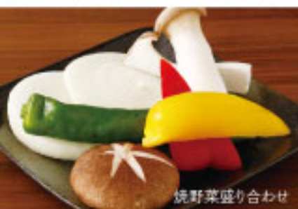
焼野菜盛り合わせ