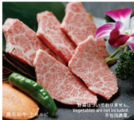
黒毛和牛 上カルビ

野菜はついておりません。 Vegetables are not included. 不包括蔬菜。