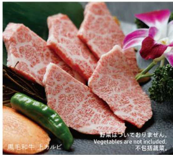
黒毛和牛 上カルビ

野菜はついておりません。 Vegetables are not included. 不包括蔬菜。