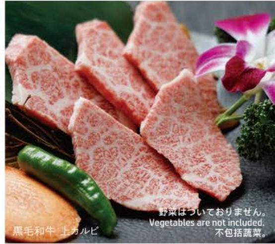
黒毛和牛 上カルビ

野菜はついておりません。 Vegetables are not included. 不包括蔬菜。