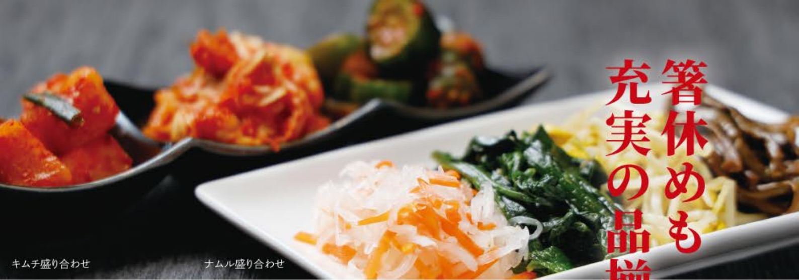
キムチ盛り合わせ