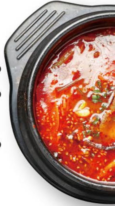
ユッケジャンクッパ