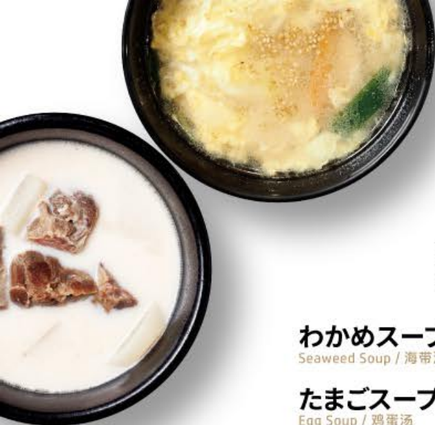
牛タン丸ごと!コムタンスープ