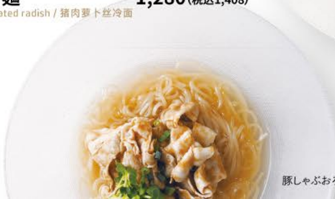
豚しゃぶおろし冷麺