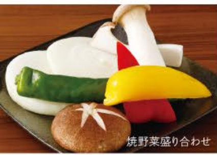
焼野菜盛り合わせ