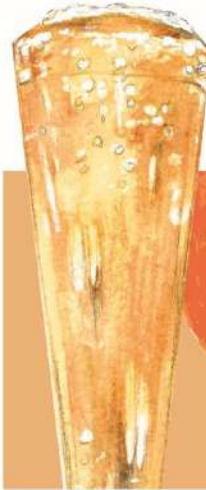
Mimosa (low alcohol) 俺のミモザ 777(税込854)