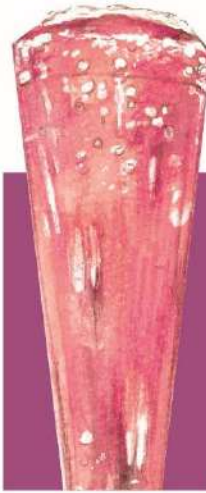
Lambrusco (sweet) ランブルスコ (甘口) 777(税込854) ボトル BOTTLE 2,800(税込3080)