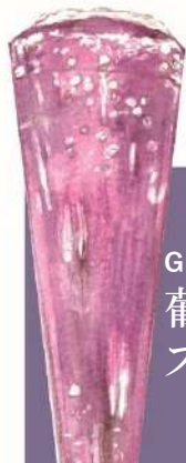
Grape Sparkling 葡萄 スパークリング 650(税込715)