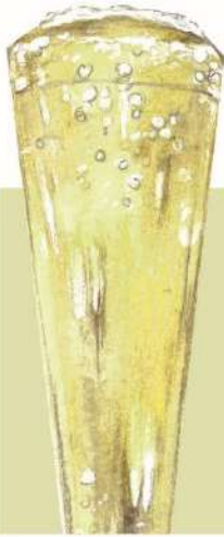
Sparkling Wine (Muscat) 私の泡 (マスカット) 777(税込854) ボトル BOTTLE 2,800(税込3080)