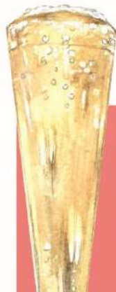
apple Sparkling 林檎 スパークリング 650(税込715)