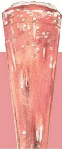
Bellini (low alcohol) 俺のベリーニ 777(税込854)