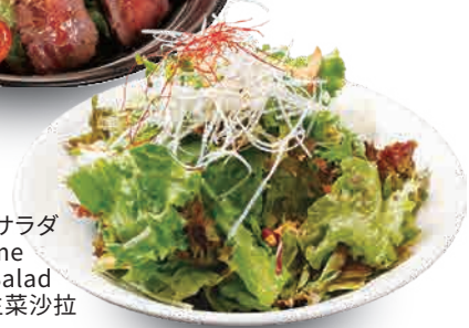
塩胡麻チョレギサラダ Salt and sesame Korean Style Salad 盐和芝麻韩式生菜沙拉