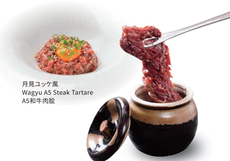
月見ユッケ風 Wagyu A5 Steak Tartare A5和牛肉脍

※低温調理で中心部まで加熱したお肉を使用しています。 *Both are cooked at a low temperature and heated to the center. Please enjoy without baking. *两者均以低温烹调并加热至中心。请直接享用，无需烘烤。