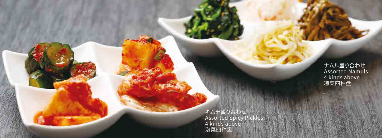
ナムル盛り合わせ Assorted Namuls: 4 kinds above 凉菜四种盘