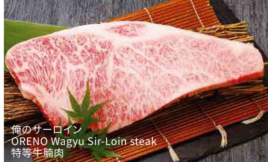
俺のサーロイン ORENO Wagyu Sir-Loin steak 特等牛腩肉