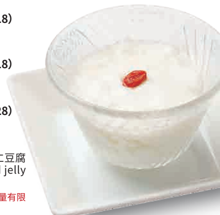
杏仁豆腐 Almond jelly

俺の杏仁豆腐 480 (税込528) ORENO Almond jelly / 杏仁豆腐