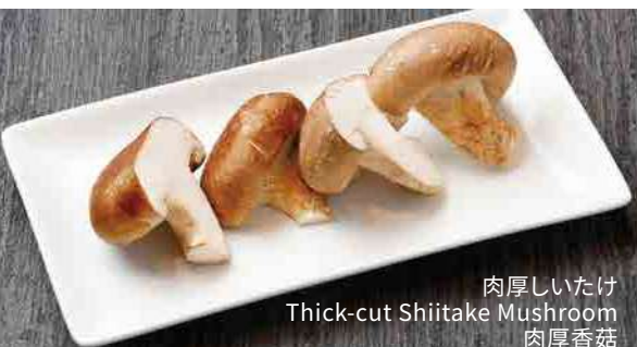
肉厚しいたけ Thick-cut Shiitake Mushroom 肉厚香菇

※写真はイメージです Image is for illustration purposes / 图片仅供参考