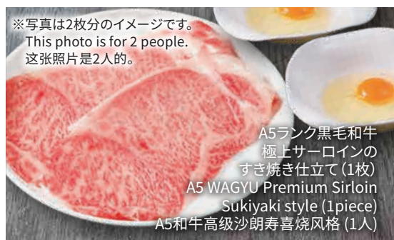
※写真は2枚分のイメージです。 This photo is for 2 people. 这张照片是2人的。