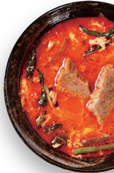
カルビクッパ Spicy Beef Short Rib Soup with Rice 韩式牛小排汤泡飯