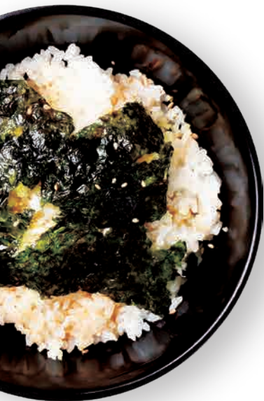
焼肉専用ご飯 Yakiniku sauce, rice, diced leek and seaweed 特制烤肉酱、葱花、芝麻、 与海苔碎