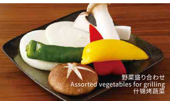
野菜盛り合わせ Assorted vegetables for grilling 什锦烤蔬菜

ニンニクオイル焼き 580 (税込638) Galic for boiling with sesame oil / 大蒜芝麻油烤