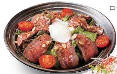
ローストビーフサラダ Roast beef salad 烤牛肉沙拉