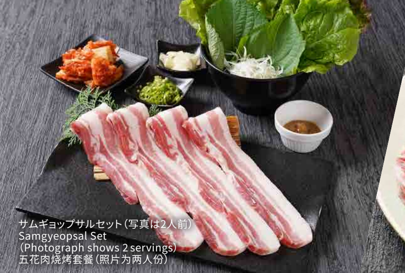
サムギョップサルセット (写真は2人前) Samgyeopsal Set (Photograph shows 2 servings) 五花肉烧烤套餐 (照片为两人份)