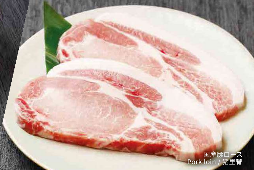
国産豚ロース Pork loin / 猪里脊

※全てのお肉は、必ず中心部まで加熱して、火の通りを確認してお召し上がりください。 ※Please make sure to cook all meat thoroughly and check that it is cooked through before eating. ※所有肉类均应煮至中心位置，以确保熟透。