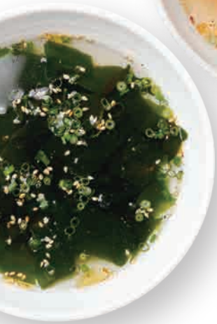
わかめスープ Seaweed Soup 海带汤