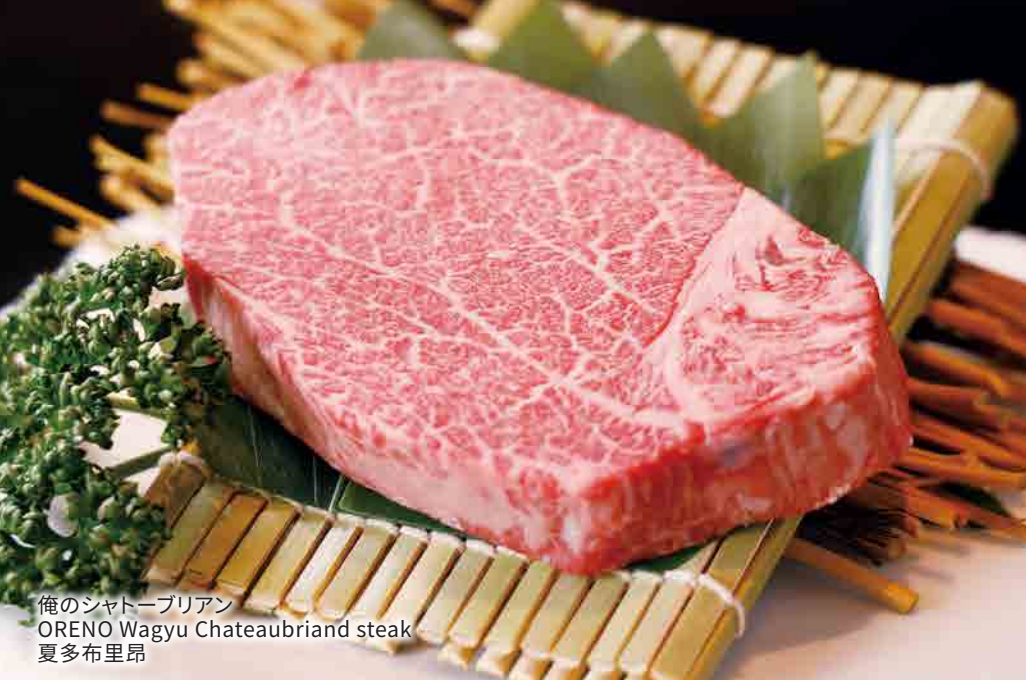
俺のシャトーブリアン ORENO Wagyu Chateaubriand steak 夏多布里昂