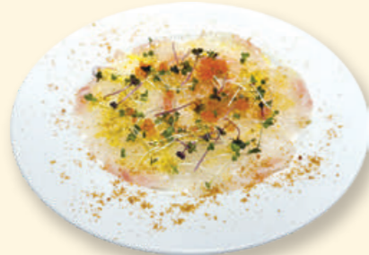
本日鮮魚のカルパッチョ