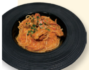
渡り蟹の トマトクリーム パスタ