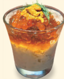
蟹のタルタルムースとオマール海老のコンソメジュレ ~雲丹とイクラをのせて~